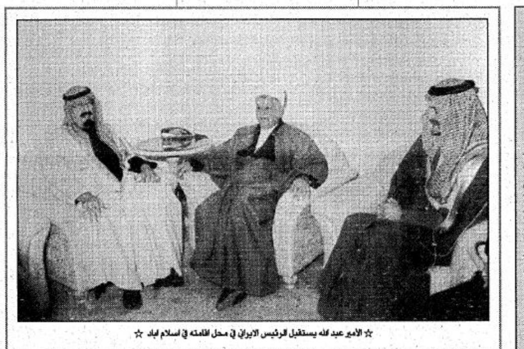
الملك فهد بن عبد العزيز آل سعود والملك عبد الله بن عبد العزيز آل سعود

ووصل عرفات مساء امس الى اسلام اباد من دون ان يبدي بأي تصريح وفي تصريح اعتبر مؤشرا لهجة خطابه امام مؤتمر اسلام اباد باسم للجموعة العربية شدد عرفات في مسقط التي