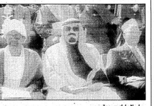
اسلام اباد - رويتر.

شاهد زعماء العالم الاسلامي امس الاحد عرضا عسكريا مر في شوارع العاصمة اسلام اباد قبل ان يبدأوا اجتماع قمة خاصا لمدة يوم واحد للاحتفال باليوبيل الذهبي لاستقلال باكستان.