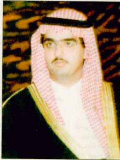
○ الأمير عبدالعزيز بن فهد بن عبدالعزيز

أخرى: أشاد الأمير عبدالعزيز بن فهد بمشاركة جيايد سمو الشيخ راشد بن محمد آل مكتوم في سباق القعة (كأس خادم الحرمين الشريفين) مشيراً إلى أن ذلك يؤكد تلاحم أبناء الخليج في شتى المناسبات. وأعلى سمو الأمير عبدالعزيز الفرس «ماتهاب» و«الطويل» النصيب الأكبر من حظوظ الترشحات لشوط الإنتاج، وتضمني توفيقاً لماتهاب» في مهمتها الوطنية القادمة عبر سباق كأس العالم بببسي، معتبراً هذه المشاركة خطوة رائدة من الأسطبل الأزرق لخيل الوطن بما له من باع طويل وبما حققه من نتائج مؤخرًا تؤكد أنه الأفضل حالياً لتمثيل خيل الإنتاج السعودية.