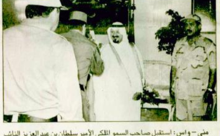
منى - واس: استقبل صاحب السمو الملكي الأمير سلطان بن عبد العزيز النائب الثاني لرئيس مجلس الوزراء وزير الدفاع والطيران والمفتش العام بقصر سموه بعنى امس اصحاب السمو الملكي الامراء بتقديم صاحب السمو الملكي الامير ماجد بن عبد العزيز امير منطقة مكة المكرمة واصحاب السمو الشيوخ