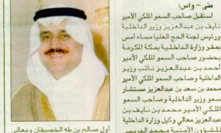
منى - واس: استقبل صاحب السمو الملكي الأمير نايف بن عبدالعزيز وزير الداخلية ورئيس لجنة الحج العليا مساء امس بمقر وزارة الداخلية بمكة المكرمة بحضور صاحب السمو الملكي الأمير أحمد بن عبدالعزيز نائب وزير الداخلية وصاحب السمو الملكي الأمير محمد بن سعد بن عبدالعزيز مستشار سمو وزير الداخلية وصاحب السمو الملكي الأمير محمد بن نايف بن عبدالعزيز معالي وكيل وزارة الداخلية للشؤون الأمنية محمد الفريسي ومعالى مدير عام الباحث العامة ورئيس لجنة الضباط العليا لقوات الأمن الداخلي بوزارة الداخلية الفريق