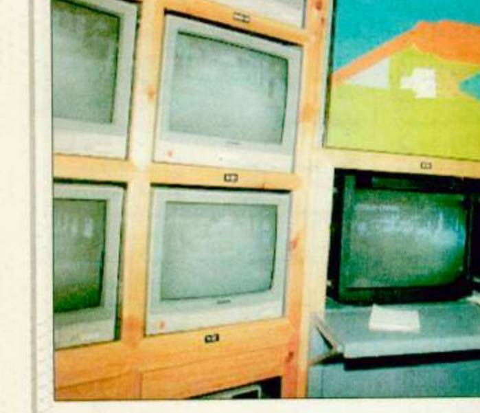
من هنا يركز القيادة والسيطرة يتم التحدث والغاء الصوتي لجسر الجمرات والساحات المحيطة به

يتم من خلالها التحدث للحجاج بعدة لغات تجهيز جسر الجمرات بـ (٦٦٨) سماعة