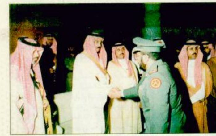
منى - واس: استقبل صاحب السمو الملكي الأمير عبد العزيز ولي العهد ونائب رئيس مجلس الوزراء ورئيس الحرس الوطني في منى امس اصحاب السمو الملكي الامراء واصحاب السمو الشيوخ والمعالى والمسؤولين الذين أدوا مناسك حج هذا العام بتقديم صاحب السمو الشيخ خليفة بن حمد آل ثاني.