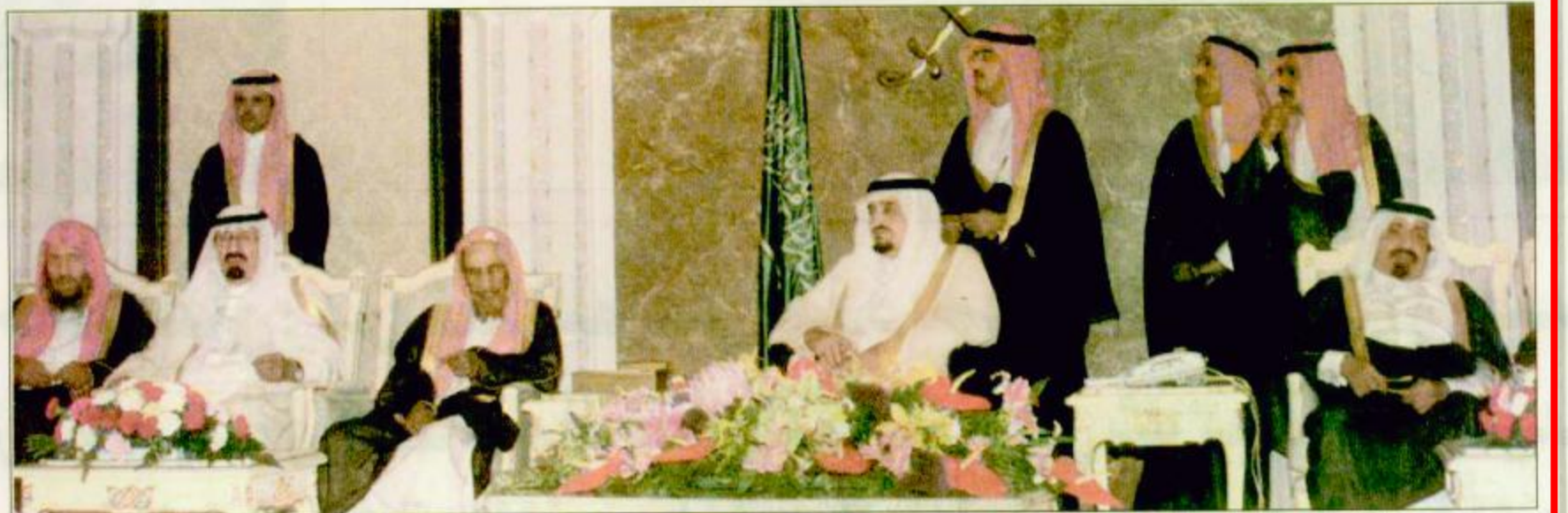
منى - واس: استقبل خادم الحرمين الشريفين الملك فهد بن عبدالعزيز آل سعود حفلة الله في الديوان الملكي بقصر منى امس اصحاب السمو الملكي الامراء واصحاب السمو الشيوخ والمعالى والمسؤولين من دول مجلس التعاون لدول الخليج العربية الذين أدوا مناسك حج هذا العام بتقديم صاحب السمو الشيخ خليفة بن حمد آل ثاني.