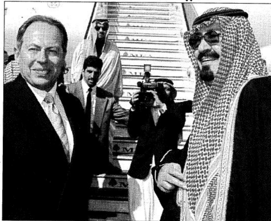
لقطعان من مغادرة سمو الأمير عبدالله لطار بيروت الدولي مودعاً من الرئيس لحود ورئيس الوزراء الحص