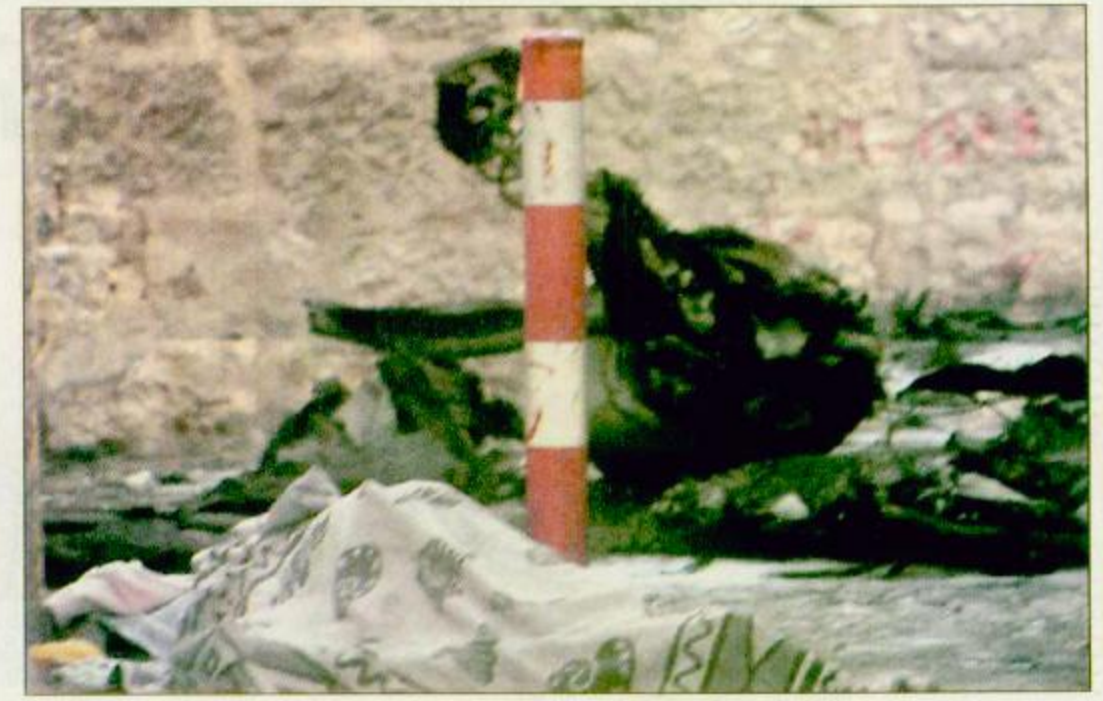
○ القدس - (ا.ف.ب): أحد قتلى السيارة المفخخة التي انفجرت في القدس قرب سوق ماهاني يهودا

شهيان منذ الاتفاق.. والقيادة الفلسطينية تسدو إلى الهدوء وحماس ترفض وقف الانتفاضة ○ الأراضي الفلسطينية - واشنطن - الوكالات: أفادت مصادر في الشرطة الإسرائيلية أن عبوة يدو أنها سيارة مفخخة انفجرت بعد ظهر أمس الخميس في أحد الأحياء الشعبية والتجارية في القدس الغربية مما أسفر عن مقتل شخصين و١٥ جرحى على الأقل. وعلم من مصادر في الشرطة ان إحدى ضحيتي انفجار السيارة الملقومة هي ابنة اسحق ليفي، زعيم الحزب الوطني الديني الذي يمثل المستوطنين. وقال مسؤول في الشرطة لوكالة فرانس برس طالباً عدم ذكر اسمه ان ايليت ليفين ابنة اسحق ليفي، هي إحدى ضحيتي الانفجار. وقد أعلن الجناح المسلح للجهد الإسلامي في فلسطين في بيان أمس الخميس مسؤوليته عن الاعتداء بالسيارة الملقومة الذي أسفر عن مقتل اسرائيليين اثنين في القدس الغربية. وأكد بيان «سرايا» القدس الذراع العسكرية لحركة الجهاد الإسلامي في فلسطين، المسؤولية عن العملية الطويلة. وقال البيان: تعلن سرايا القدس الذراع العسكرية لحركة الجهاد الإسلامي في فلسطين مسؤوليتها عن العملية الطويلة. وأضاف البيان، ان سرايا القدس تؤكد ان هذا العمل هو جزء من دينا على جرائم العدو ضد شعبنا الفلسطيني الأزل، ونقول لجزرالات العدو كما قلنا سابقاً ان دم الطالطا في شوارع غزة والضفة ومناطق القدس لن ينضب هناء، وانتظروا المزيد فإننا قادمون بعون الله وعزيمة شعبنا ومجاهدينا البقية ص ٢٣. - طالع ص ٢٤