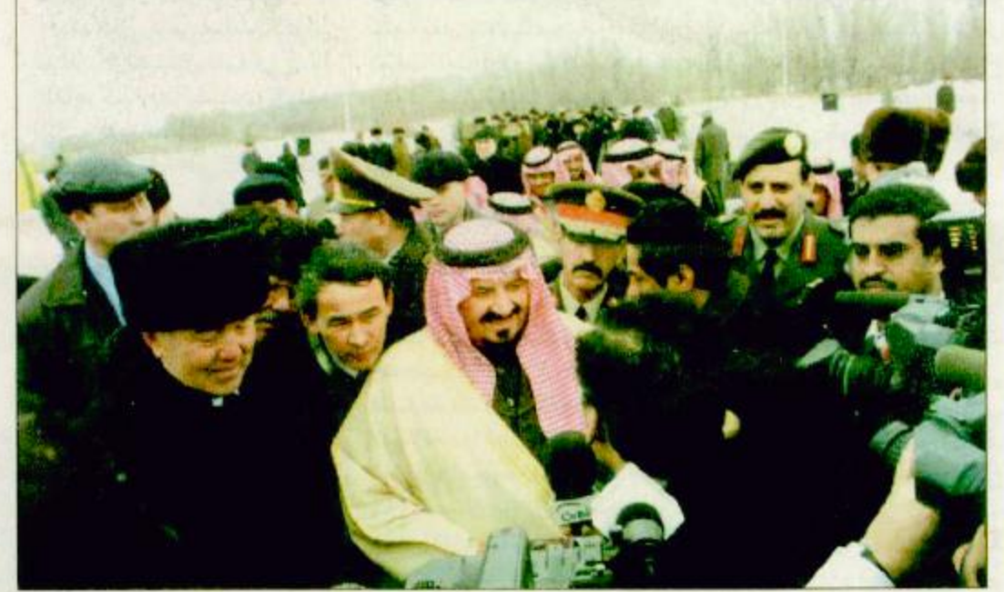
○ الأمير سلطان يضع حجر الأساس لمبنى البرلمان الكازاخستاني

○ اسطنة - رئيس التحرير - واس: تبرع خادم الحرمين الشريفين الملك فهد بن عبدالعزيز آل سعود حفظة الله بمبلغ خمس ملايين دولار لإنشاء مركز طبي في أستانا بجمهورية كازاخستان. أعلن ذلك صاحب السمو الملكي الأمير سلطان بن عبدالعزيز النائب الثاني لرئيس مجلس الوزراء وزير الدفاع والطيران والمفتش العام في تصريح صحفي أمس عقب وضع سموه حجر الأساس لمشروع المبنى الجديد للبرلمان الكازاخستاني. وأوضح سموه ان التعاون بين المملكة العربية السعودية وجمهورية كازاخستان لا يقتصر على مجالات البناء والتنمية وإنما يمتد ليشمل بناء الانسان المسلم على أسس العبادة الاسلامية الصحيحة والمحبة والآداء. وأعرب سمو النائب الثاني عن سعاده بوضع حجر الأساس لمبنى البرلمان لخدمة الشعب الكازاخستاني المسلم. وحول سؤال عن نتائج مباحثات سموه مع المسؤولين الكازاخستانيين أكد سمو الأمير سلطان بن عبدالعزيز على تفاق وجاهات النظر في جميع الموضوعات. وقام صاحب السمو الملكي الأمير سلطان بن عبدالعزيز النائب الثاني لرئيس مجلس الوزراء وزير الدفاع والطيران والمفتش العام صباح أمس بزيارة مبنى البرلمان في جمهورية كازاخستان. وكان في استقبال سموه ورئيس مجلس الشيوخ لبرلمان جمهورية كازاخستان اورل باي عبدالكريموف. وقد التقى سموه باعضاء مجلس الشيوخ الكازاخستاني حيثلقى رئيس مجلس الشيوخ في البرلمان الكازاخستاني كلمة ترحيبية عبر فيها عن سعاده بالزيارة الرسمية التي يقوم بها صاحب السمو الملكي البقية ص ٢٣. - طالع ص ٢٤