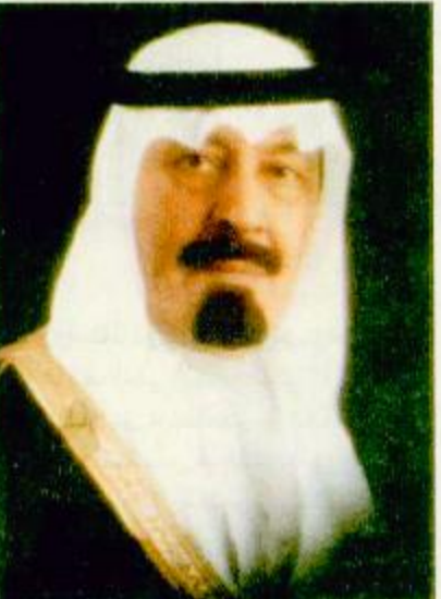
○ الأمير عبدالله بن عبدالعزيز

○ الرياض - عايض اليغمي - واس: يرعى صاحب السمو الملكي الأمير عبدالله بن عبدالعزيز ولي العهد ونائب رئيس مجلس الوزراء ورئيس الحرس الوطني ورئيس نادي الفروسية عصر اليوم الجمعة حفل سباق الخيل الكبير على كأس الأمير محمد بن سعود الكبير رحمه الله وذلك بميدان سباق الخيل بالمحضر. صرح بذلك صاحب السمو الملكي الفريق ركن متعب بن عبدالله بن عبدالعزيز نائب رئيس الجهاز العسكري بالحرس الوطني قائد كتيبة الملك خالد العسكرية ورئيس اللجان الفنية بنادي الفروسية. وعبر سموه عن سعاده البالغة لتشريف سمو ولي العهد لهذا الحفل وقال: «ان تشريف سمو ولي العهد هو امتداد للدعم الذي يولييه سموه لهذه الرياضة العالية على تفوسنا انطلاقاً من حرص حكومة خادم