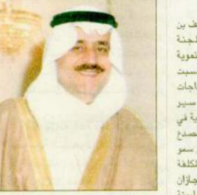
○ الأمير نايف بن عبدالعزيز

○ الرياض - واس: يقوم صاحب السمو الملكي الأمير نايف بن عبدالعزیز وزير الداخلية ورئيس اللجنة الوزارية المكلفة بدراسة الاحتياجات التنموية الأنية والمستقبلية لمنطقة جازان غداً السبت بزيارة لمنطقة جازان يتفقد خلالها احتياجات الواطنين ومتطلباتهم ويطلع على سير الاجراءات التي اتخذتها الأجهزة الحكومية في سبيل مواجهة مرض حمى الوادي المتصدع والقضاء عليه بمشية لله تعالى ويرأس سمو وزير الداخلية رئيس اللجنة الوزارية المكلفة بدراسة الاحتياجات التنموية لمنطقة جازان خلال زيارته للمنطقة الاجتماع الثاني للجنة الوزارية التي كانت قد عقدت اجتماعها الأول بمكتب سموه بالرياض يوم الأحد الحادي عشرون شهر رجب الماضي. وتتكون هذه اللجنة التي يرأسها سمو الأمير نايف بن عبدالعزیز من وزراء الصحة والزراعة والمياه والشؤون البلدية والقروية والمالية والاقتصاد الوطني ومعالي أمير منطقة جازان وتأتي زيارة صاحب السمو الملكي الأمير