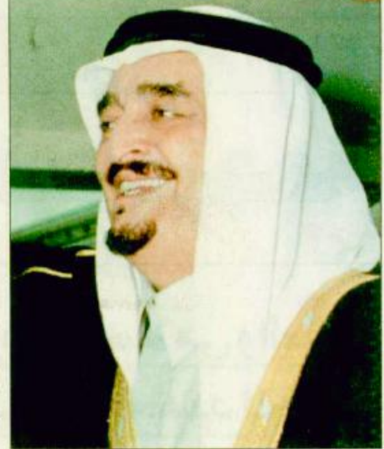
○ خادم الحرمين الشريفين

○ الرياض - واس: صدر أمر ملكي أمس فيما يلي نصه، بسم الله الرحمن الرحيم الرقم / 211 التاريخ 1421/8/6هـ بعون الله تعالى نحن عهد بن عبدالعزيز آل سعود ملك المملكة العربية السعودية بعد الاطلاع على المادة الثامنة والخمسين من النظام الأساسي للحكم الصادر بالأمر الملك رقم 90/1 وتاريخ 1421/8/27هـ وبعد الاطلاع على نظام الوزراء ونواب الوزراء وموظفي المرتبة الممتازة الصادر بالمرسوم الملكي رقم م/10 وتاريخ 13/3/191 اهـ وبعد الاطلاع على الأوامر الملكية رقم 1/201 وتاريخ 1417/9/1هـ ورقم 1/210 وتاريخ 1417/9/23هـ ورقم 1/211 وتاريخ 1417/9/23هـ وبناء على الأمر الملكي رقم 14/1 وتاريخ 1414/3هـ