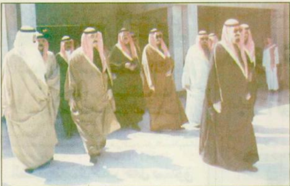
لقطات من مغادرة سمو ولي العهد الرياض الى حفر الباطن