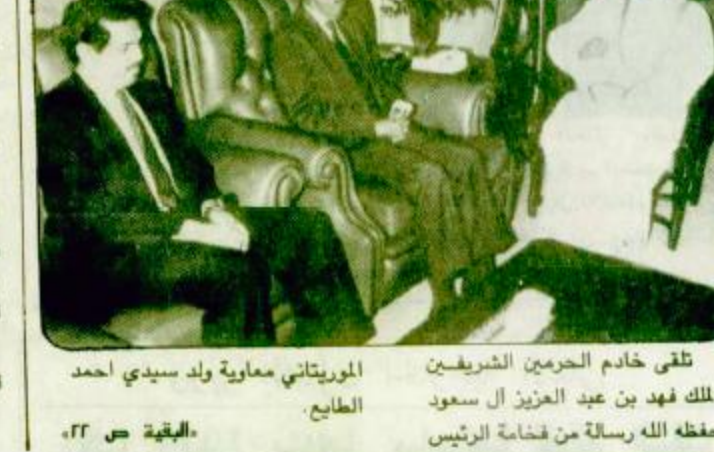
تلقى خادم الحرمين الشريفين الملك فهد بن عبد العزيز آل سعود حفظه الله رسالة من رئاسة الرئيس