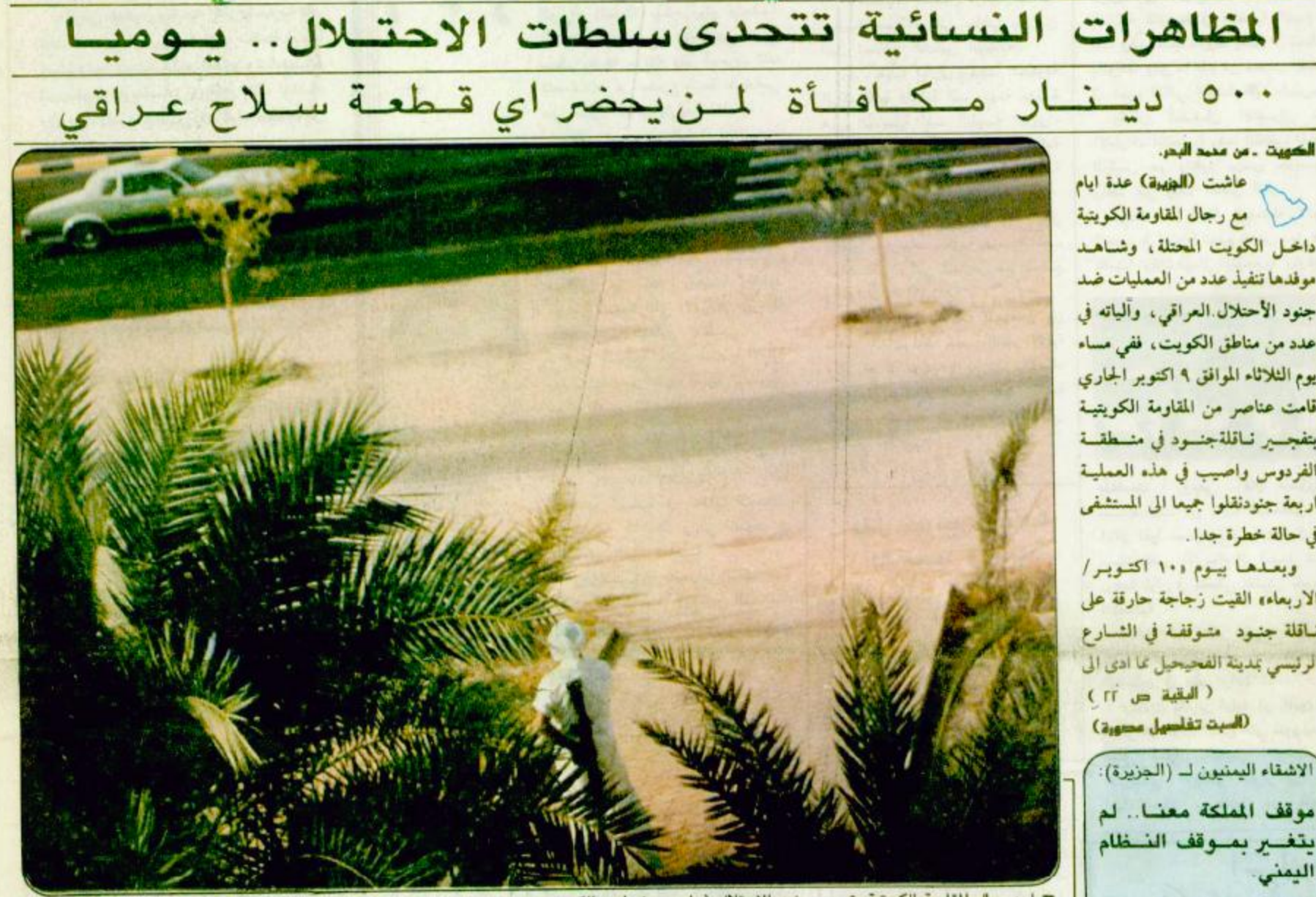
اجدرجال المقاومة الكويتية يتصد جنود الاحتلال في احد شوارع الكويت.