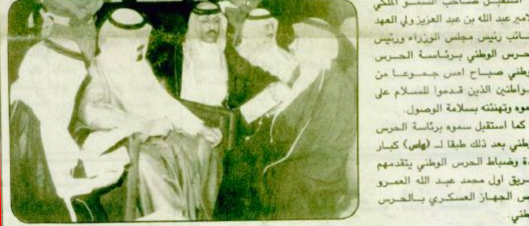
استقبل صاحب السمو الملكي الامير عبد الله بن عبد العزيز ولي العهد ونائب رئيس مجلس الوزراء ورئيس الحرس الوطني برئاسة الحرس الوطني صباح امس جموعاً من المواطنين الذين قدموا للسلام على سموه وتهنئته بسلامة الوصول.