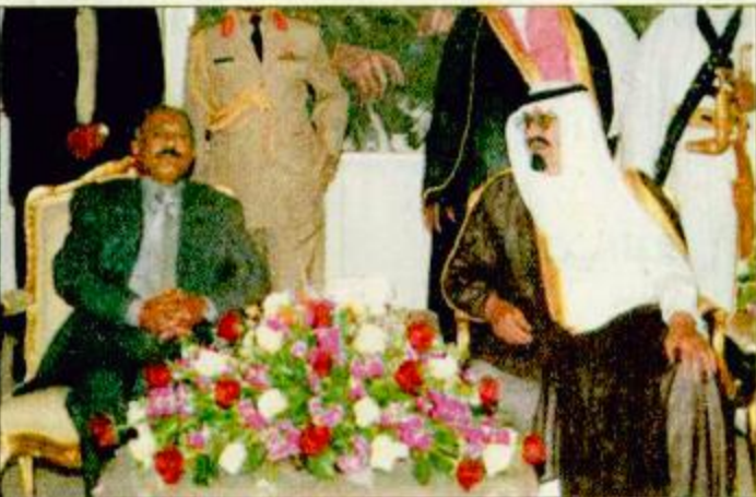
جدة - واس:

استقبله سمو ولي العهد لدى وصوله جدة علي صالح: نتطلع إلى عهد جديد من التعاون