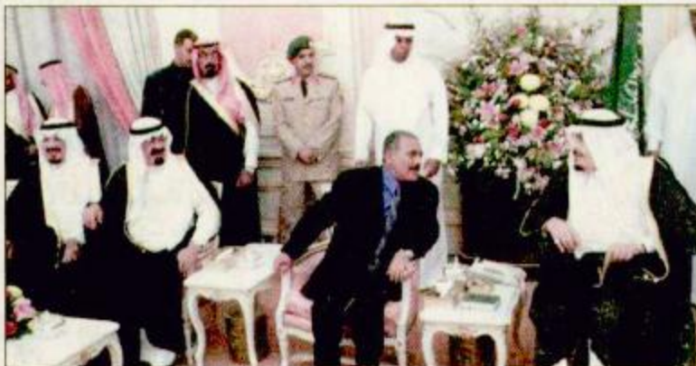
خادم الحرمين الشريفين يستقبل الرئيس اليمني - واس

استقبل خادم الحرمين الشريفين الملك فهد بن عبدالعزيز آل سعود في مكتبه بالديوان الملكي بقصر السلام مساء أمس أخاه فخامة الرئيس علي عبدالله صالح رئيس الجمهورية اليمنية والوفد المرافق له. وقد عقد خادم الحرمين الشريفين وفخامة الرئيس علي عبدالله صالح جلسة مباحثات رسمية تم خلالها بحث آفاق التعاون بين البلدين الشقيقين وسبل دعمها وتعزيزها ومجمل الأوضاع على الساحتين العربية والإسلامية والدولية وقلد