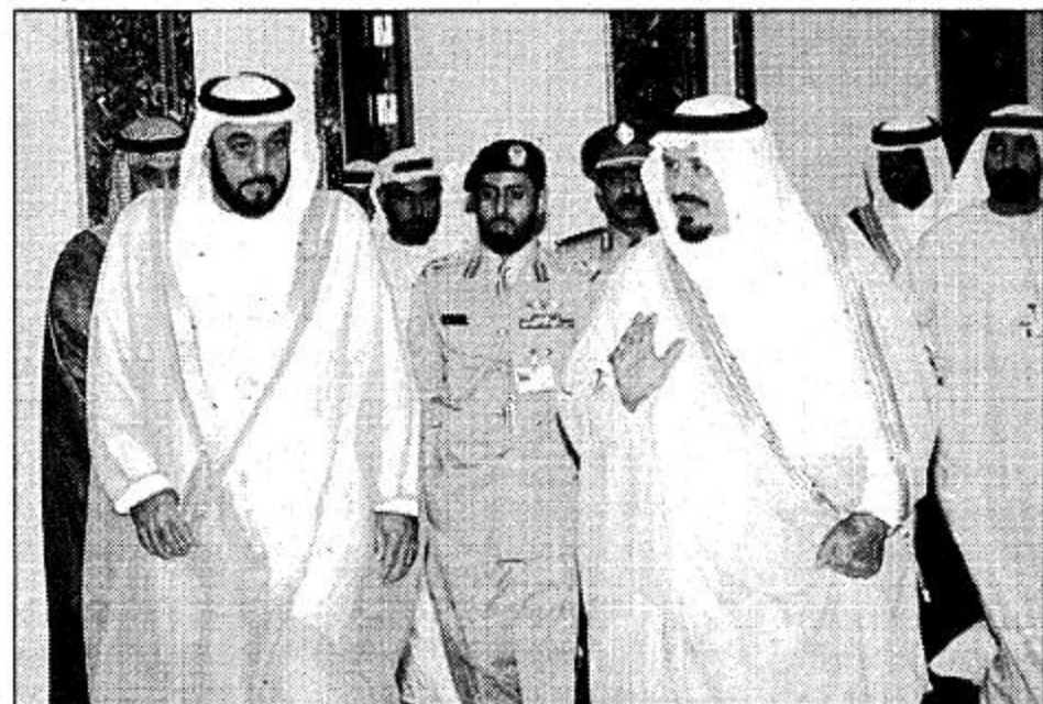
○ سمو الأمير سلطان بن عبدالعزيز وسمو الشيخ خليفة بن زايد