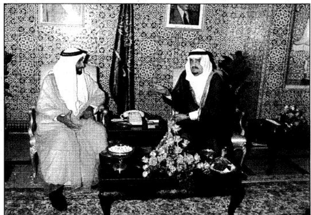
○ تواصل مستمر بين خادم الحرمين الشريفين والشيخ زايد بن سلطان