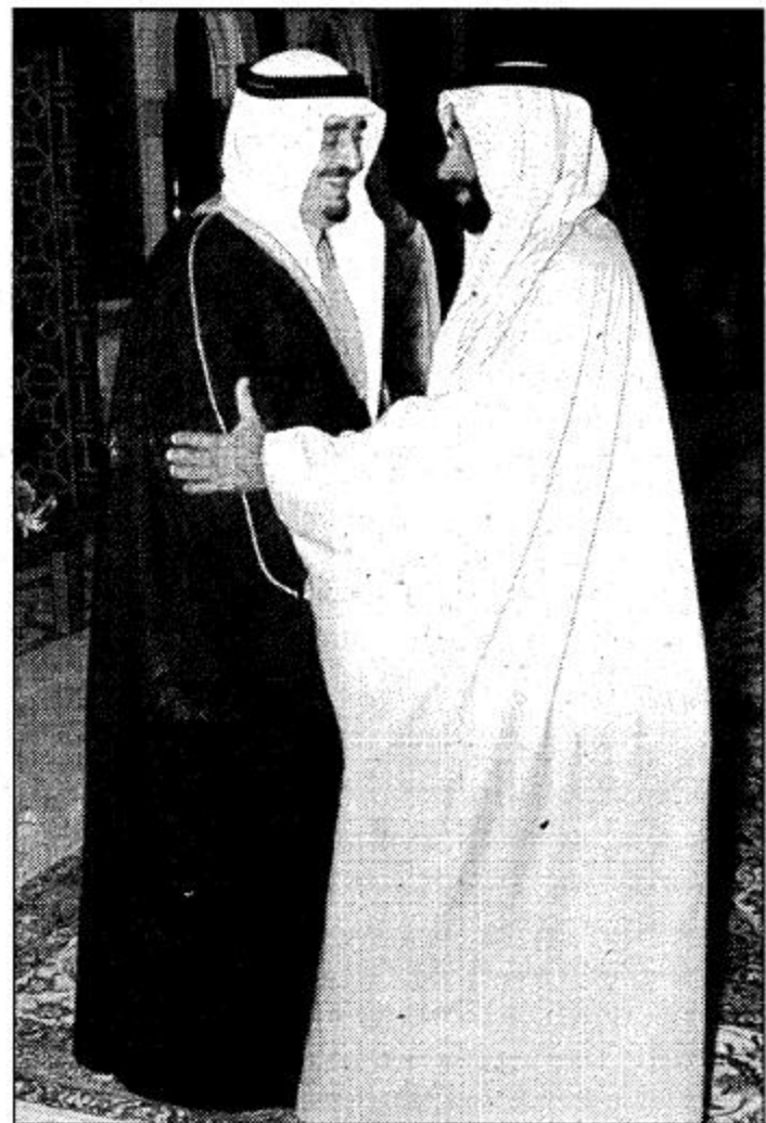
○ خادم الحرمين الشريفين وسمو الشيخ زايد بن سلطان آل نهيان في زيارة لسمو ولي العهد