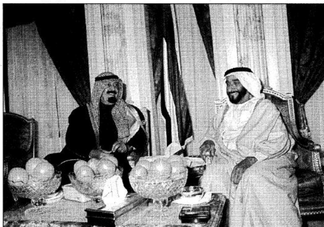
○ سمو ولي العهد يتحدث مع سمو ولي الإمارات في إحدى زيارات سموه لدولة الإمارات