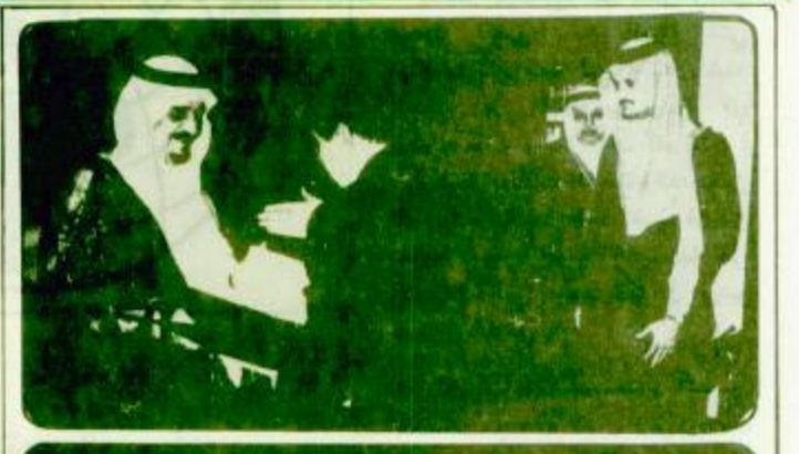
خادم الحرمين الشريفين يتسلم اوراق اعتماده سفير الجزائر وكندا

القاهرة - الجزيرة، اشاد السفير ان شيخ حسن عميد السلك الدبلوماسي العربي بالقاهرة وسفير جيبوتي لدى مصر بمواقف خادم الحرمين الشريفين الملك فهد بن عبدالعزيز على المستويين العربي والاسلامي. مؤكدا ان كل مسئول ومواطن عربي مسلم يستطيع ان يلمس جهود خادم الحرمين الشريفين لانها جهود طيبة بخيرة ومفيدة للبشرية. البحرية ٢٢،