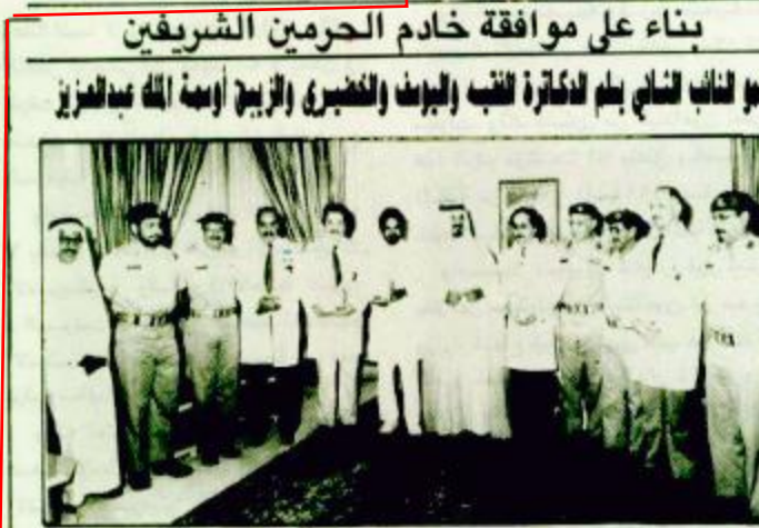
بناء على موافقة خادم الحرمين الشريفين بنو نائب الديني بلم لكتابة لقب الجوف والقبضى الرقيب أرملة الله عبدالعزیز

٩٦٨٥٢ زاروا معرض المملكة في الطلائع بلغ عدد زوار معرض المملكة بين الامس واليوم والمقام حاليا في مدينة الطلائع بولاية جورجيا الامريكينة يوم الاول ٩٦٨٥٢ زائرا. امس الاول الأحد ١٢٨٥٦.