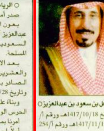
○ الأمير مشعل بن سعود بن عبدالعزيز

في أوامر ملكية ○ الرياض-واس: صدر أمر ملكي أمس هذا نصه: بسم الله الرحمن الرحيم الرقم أ: 254/ 9/26-1421هـ. يعون الله تعالى نحن فهد بن عبدالعزيز آل سعود ملك المملكة العربية السعودية. بعد الاطلاع على المادة الثامنة والخمسين من النظام الأساسي للحكم الصادر بالأمر الملكي رقم م/90 وتاريخ 1412/8/27هـ. وبعد الاطلاع على نظام الوزراء ونواب الوزراء وموظفي المرتبة الممتازة الصادر بالمرسوم الملكي رقم م/10 وتاريخ 1391/3/18هـ. وبعد الاطلاع على الأوامر الملكية رقم