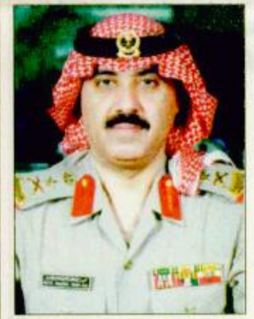
○ الفريق أول ركن متعب بن عبدالله

سموه لـ «الجزيرة»: الثقة الكريمة من ولادة الأمر هي المكسب الحقيقي الذي تشرفت به ○ الرياض-حمد الجمهور- (واس): صدر أمر ملكي فيما يلي نصه: يعون الله تعالى نحن فهد بن عبدالعزيز آل سعود ملك المملكة العربية السعودية والقائد الأعلى للقوات المسلحة. بعد الاطلاع على المادة الثامنة والعشرين من نظام خدمة الضباط الصادر بالمرسوم الملكي رقم م/43 وتاريخ 1393/8/28هـ. وبناء على ما عرضه علينا سمو رئيس الحرس الوطني. أمرنا بما هو آت: أول- إحداث منصب نائب رئيس الحرس الوطني المساعد للشؤون العسكرية في رتبة فريق أول وتعيين الأمير متعب بن عبدالعزيز نائباً لرئيس الحرس الوطني المساعد للشؤون العسكرية. ثانياً- برفق الفريق ركن متعب بن عبدالله بن عبدالعزيز آل سعود إلى رتبة فريق أول ويعين نائباً لرئيس الحرس الوطني المساعد للشؤون العسكرية. ثالثاً- على سمو رئيس الحرس الوطني تنفيذ أمرنا هذا. فهد بن عبدالعزيز وبهذه المناسبة عبر صاحب السمو الملكي الفريق أول متعب بن عبدالله بن عبدالعزيز نائب رئيس الحرس الوطني المساعد للشؤون العسكرية عن بالغ امتنانه للثقة الملكية الكريمة بترقيته إلى اللان القوي صاموئيل بيرغر. البقية ص ٣٧.