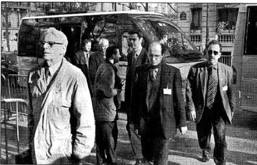
باريس، فرنسا. زعيم كوسوفو المعتدل إبراهيم روجوا، و«س»، و«دريس إيجيتي»، و«سار» عضو الوفد الألبان الأصل بصلان في مركز المؤتمرات الدولي في باريس لاستئناف مباحثات السلام بين سكان كوسوفو للتخفيف من أصل الجاني والصرب في حل مرض في أسرع وقت خلال هذا الأسبوع.

بلهجة متشددة في الوقت الذي لم يخف أحد عن حقيقة الوضع. وقال راتكو ماركو فيتش نائب رئيس الوزراء وكبير مفوضي يوغوسلافيا للصرب في باريس أن الحكومة المركزية لن تتخل عن كوسوفو.