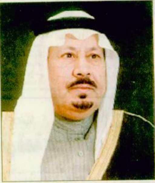
الأمر بدر بن عبدالعزيز □

أعرب صاحب السمو الملكي الأمير بدر بن عبدالعزيز آل سعود نائب رئيس الحرس الوطني، نائب رئيس نادي الفروسية عن فخره واعتزازه بإقامة سباق الخيل الكبير على كأس الموحد صاحب الجلالة الملك عبدالعزيز بن عبد الرحمن آل سعود (طيب الله ثراه) والتي تجمعه منذ إقامة مع احتفالات البلاد بموعد مائة عام على دخول جلالتهم الرياض.. وهي أقل ما يمكن أن يقدمه نادي الفروسية لأحياء ذكرى ذلك الرجل العظيم الفارس البطل الذي امتدحت سموات الخيل لتوحيد هذه البلاد الكبيرة تحت راية لا إله إلا الله محمد رسول الله، وإحياء ذكرى المؤتمنين الأرائل الذين نشروا الإسلام في أصقاع المعمورة على ظهور الجياد، وأعاد لها مكانتها وعزتها، وحرصاً من الله عليه على اقتنائها وإكرامها، وكان يشجع أبناءه على ركوب الخيل، وأضاف سمو الأمير بدر أن تنظيم مهرجان الفروسية على كأس الملك عبدالعزيز سيكون يوماً مشهوداً وخالداً، ومناسبة تاريخية سعيدة لأبناء الوطن عموماً وعشاق ومحبي الفروسية بشكل خاص. وتقدم سمو الأمير بدر في ختام تصريحه بالشكر والتقدير لمقام خادم الحرمين الشريفين وسمو ولي عهده الأمين حفظهما الله لما تلقاهم رياضاً الفروسية من دعم وتشجيع متمنياً أن يظهر حفل السباق الكبير على كأس الملك عبدالعزيز بالظهور الشرف الذي يولاه أهمية هذه المناسبة العظيمة على الجميع.