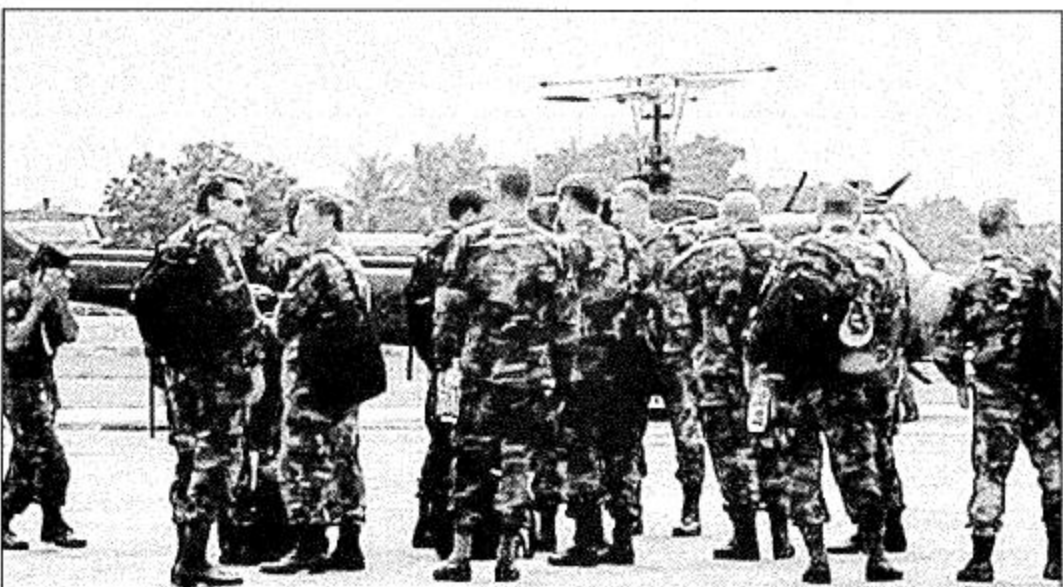
زامبونجا - الفلبين (أ. ف. ب): أفراد مجموعة عسكرية استشارية من الأمريكيين يصلون إلى ميناء زامبونجا جنوب الفلبين، ولم توضح حكومة الفلبين سبب الزيارة.