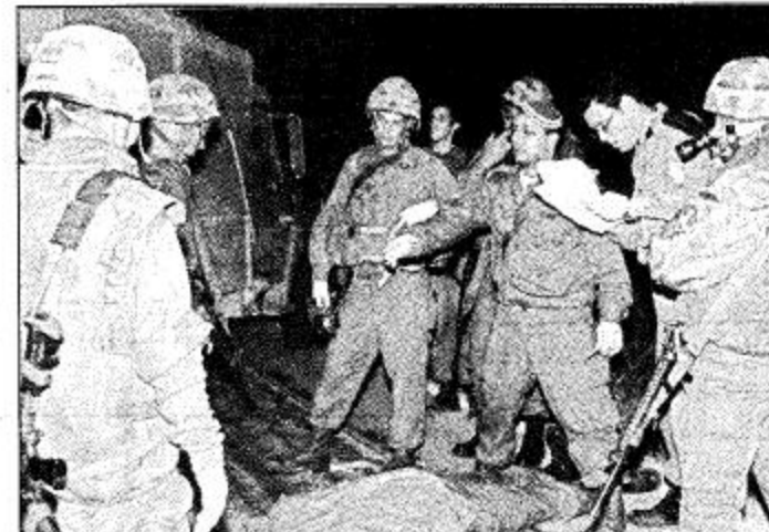
جنود إسرائيليون في مسرح العملية

وقالت مصادر مقربة من المستعمرين ان الهجوم بدأ بانفجار عبوة شديدة القوة وضعت على حافة الطريق، ثم فتح المسلحون النار بالأسلحة الرشاشة قبل ان يطلقوا قنابل على الباص. وأضاف المصدر نفسه ان الباص الذي لم يكن مصفحا كان متوجها من بني