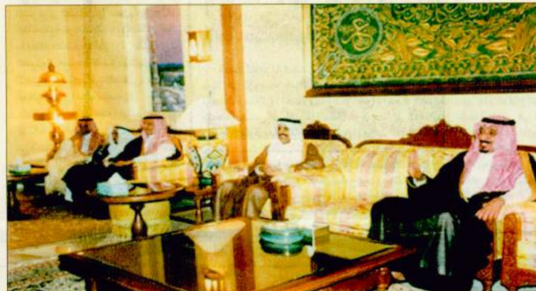
جدة - مكتب الجزيرة: