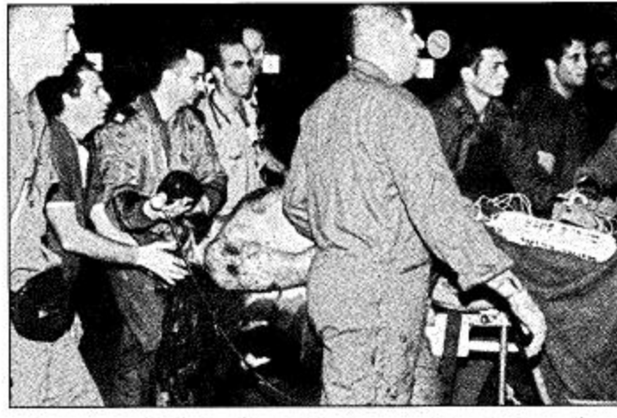
إسرائيلي جريح في الهجوم على الحافلة

وأضاف المصدر نفسه ان مواطنين فلسطينيين في غارتين شنتهما مروحيات إسرائيلية على الحى النمساوي غرب مدينة خان يونس جنوب قطاع غزة فجر أمس في وقت فيه وسطاء امريكيون وأوروبيون وروس الخطى لإيجاد مخرج من حالة العنف فيما استهدفت كل من نيوزيلندا وماليزيا حملات الاغتيال الإسرائيلية.