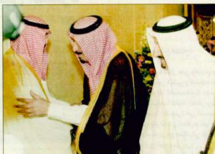
الأمير عبدالله يغادر مكة المكرمة