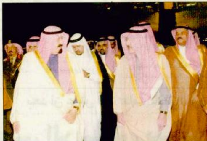
وصول الأمير عبدالله للرياض