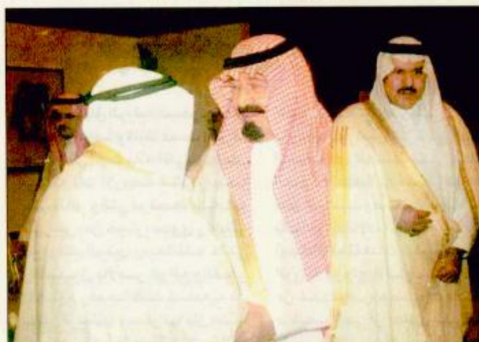
الأمير عبدالله يغادر جدة متوجهاً للرياض