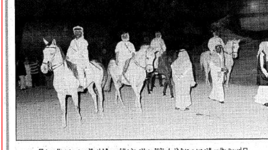
□ لوبيريت «فارس التوحيد» حدث فني استثنائي صاغه حفيد المؤسس الشاعر الأمير بدر بن عبدالحسن □