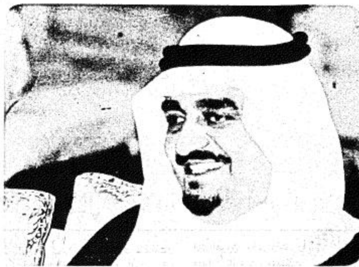
اشادا بجهود العاملين في سابق