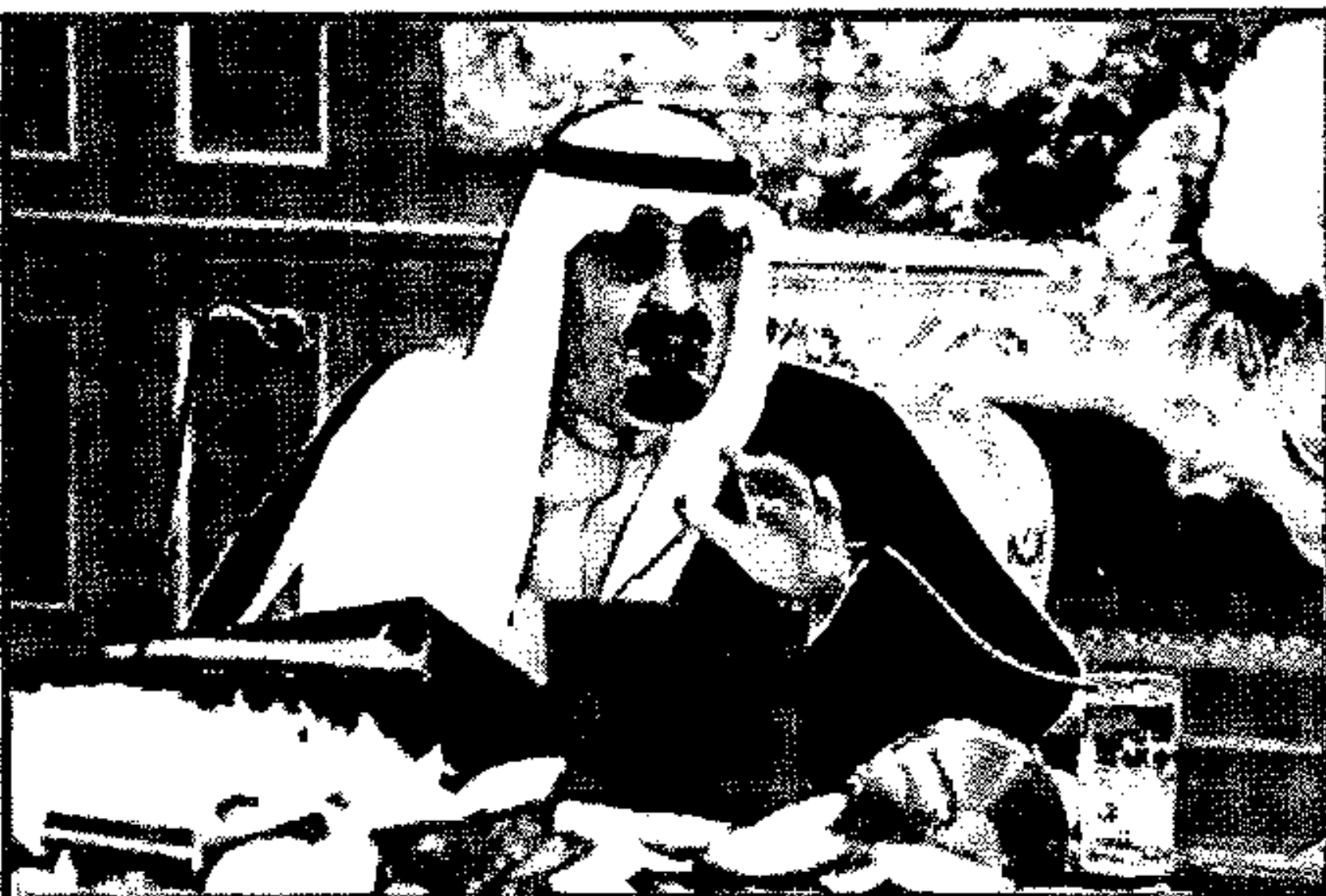
نولي حاسم لوضع حد لهذه الكارثة والزام إسرائيل بالاستجابة لقرار مجلس الأمن الأخير حول وقف إطلاق النار وانسحاب القوات الإسرائيلية من القطاع.