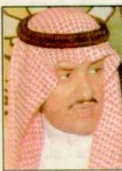
الأمير سلطان السديري وسمو الأمير سلطان ابن سلمان رعاية الأطفال المعاقين بالجوف

الجوف - خالد الحميد - وجميل موسى الحميد: يفتح معالي الأمير سلطان بن عبد الرحمن السديري أمير منطقة الجوف وصاحب السمو الملك الأمير سلطان بن سلمان بن عبدالعزيز رئيس مجلس إدارة الجمعية السعودية الخيرية لرعاية الأطفال المعاقين عصر اليوم الأربعاء مركز رعاية وتأهيل الأطفال المعاقين بالجوف وذلك بحضور معالي الأستاذ مساعد بن محمد السديري وزير العمل والشؤون الاجتماعية وأعضاء مجلس إدارة الجمعية السعودية الخيرية لرعاية الأطفال المعاقين وأعضاء جمعية البر الخيرية بمنطقة الجوف وعدد من المسؤولين ورجال الأعمال وذلك في مقر المركز بشعار الملك فهد في مدينة سكاكا.