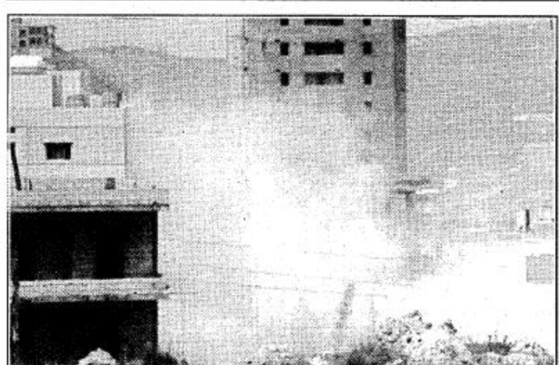
اكثر من ستة صواريخ قذفتها الطائرات المروحية يوم اول امس - الأحد - على الضاحية الجنوبية من بيروت، اصابت حارة حريك، بئر العبد، الغبيري. ويوم امس كان يوماً عاصيباً جداً في بيروت حيث ضربت العاصمة. فاصاب صاروخ محطة كهرياء في صليم في الضاحية الشرقية من بيروت. وكانت محطة الجمهور قد استهدفت يوم امس الاول. بيروت تعيش ظلاماً موحشاً داساً الناس في هلع، وذعر فسماء بيروت العاصمة تجرهبها الروحيات الاسرائيلية، تتوقف مروحية في الجو لحظة وتصب نيرانها على هدف يكون نتيجته دمارا أكثر، وضحايا أكثر، وتشريدا أكثر. «عناقيد الغضب» لم تغضب أحداً حتى الآن. ولبنان يعد يده الى المطلق. الى المجهول. وأخيراً.. يمكس بالسراب.. انه يحترق. بيروت، مكتب الجزيرة الاقليمي

الامم المتحدة: رويتر اتهم المبعوث الفلسطيني لدى الامم المتحدة اسرائيل امس بمحاصرة الاراضي الفلسطينية) واتخاذ اجراءات اخرى منها نسف المنازل وتنفيذ عمليات اغتيال سياسية. وكان المبعوث ناصر القدوة يشترك في مناقشات عن الوضع في الضفة الغربية وقطاع غزة اللذين اغلقتهما اسرائيل منذ سبعة اسابيع اثر تفجيرات انتحارية قامت بها حركة المقاومة الاسلامية حماس. وحال اغلاق المناطق الفلسطينية دون سفر نحو 60 الف فلسطيني الى اسرائيل للعمل هناك مما اضر بشدة بالاقتصاد الفلسطيني. وشجب القدوة ايضا (تصعيد العدوان الاسرائيلي على لبنان). وقال جاد يعقوبي سفير اسرائيل لدى الامم المتحدة ان اغلاق الضفة وقطاع غزة (ليس عقابا جماعيا) ولكنه يهدف فقط الى ضمان أمن الشعب الاسرائيلي. وقال ان الغلاق يهدف الى (اعادة الشعور بالامن للشعب الاسرائيلي عن طريق منع الارهابيين المسلحين من التسلسل الى اسرائيل). وقال يعقوبي الذي صافح القدوة خارج قاعة مجلس الأمن قبل بدء الدورات ان القيود على دخول الفلسطينيين لاسرائيل خففت في الآونة الاخيرة حيث سمح لسبعة الاف فلسطيني من غزة بدخول اسرائيل للعمل يوميا وانه منذ الثامن من ابريل نيسان الحالي سمح لن تبليغ اعمارهم 45 عاماً وأكثر بدخول اسرائيل. ومن المقرر تبني مشروع قرار او اصدار بيان في ختام الدورات. وقال القدوة ان القيود على حركة الاشخاص والبضائع داخل الضفة الغربية وغزة ومن هذه المناطق واليهما (تمثل حصرا للاراضي الفلسطينية وخلق الشعب الفلسطيني واقتصاده). ولكنه قال ان السياسات الاسرائيلية