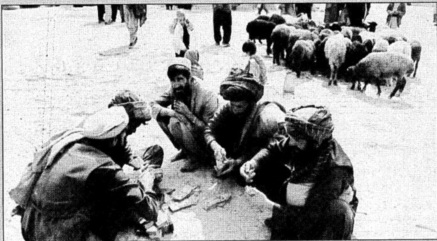
كابول - أفغانستان

تجار للمشية في السوق خارج مدينة كابول بعد قصف سفقتهم.. ميليشيات طالبان طلبت من التجار تخفيض اسعار المشية حتى يتمكن الناس محدودو الدخل من الشراء.