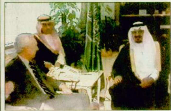
جدة - واس

استقبل صاحب السمو الملكي الأمير سلطان بن عبد العزيز النائب الثاني لرئيس مجلس الوزراء وزير الدفاع والطيران والمفتش العام بمكتب سموه بجدة بعد ظهر امس خير بشون الشرق الاوسط في لجنة العلاقات الدولية بمجلس النواب الأمريكي الدكتور كيث كاتزن. وحضر الاستقبال السفير الأمريكي لدى المملكة العربية السعودية وات فولر.