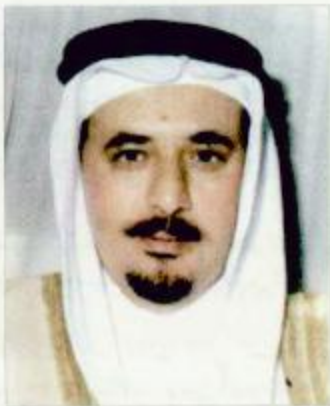
مدير جامعة الإمام

استجابة لدعوة صاحب السمو الملكي الأمير عبدالله بن عبدالعزيز ولي العهد نائب رئيس مجلس الوزراء ورئيس الحرس الوطني للمشاركة في استراتيجية وطنية للحد من الفقر، مع وزارة العمل والشؤون الاجتماعية من أجل وضع استراتيجية وطنية لمعالجة الفقر، فقد تلقى وزير العمل والشؤون الاجتماعية الدكتور علي بن إبراهيم النملة خطاباً من معالي مدير جامعة الإمام محمد بن سعود الإسلامية الدكتور محمد بن سعد السالم يعرض فيه استعداد الجامعة ومنسوبيها للمشاركة في