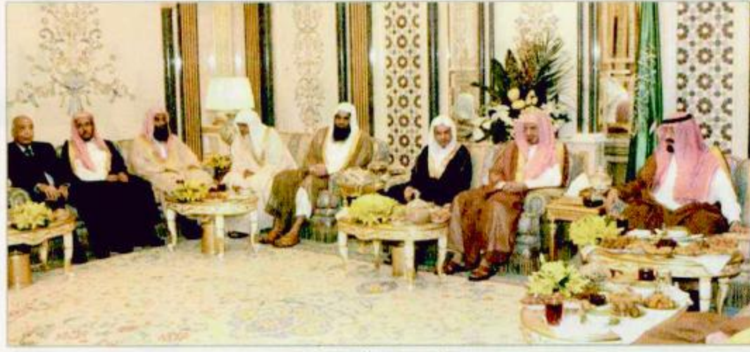
استقبال الأمير عبدالله لأئمة المسجد الحرام

استقبل صاحب السمو الملكي الأمير عبدالله بن عبدالعزيز ولي العهد نائب رئيس مجلس الوزراء ورئيس الحرس الوطني في قصر الصفا بمكة المكرمة قبل مغرب أمس معالي رئيس مجلس الشورى الشيخ صالح بن حميد ومعالي الرئيس العام لشؤون المسجد الحرام والمسجد النبوي الشريف الشيخ صالح بن الحسين وأصحاب الفضيلة أئمة المسجد الحرام ومعالي الشيخ محمد السبيل والشيخ الدكتور عبدالرحمن السديس والشيخ الدكتور سعود الشريم والشيخ الدكتور أسامة خياط والشيخ صالح بن طالب وأئمة الحرم النبوي الشريف الشيخ الدكتور علي الحذيفي والشيخ حسين آل الشيخ والشيخ صالح بن دبير. وحضر الاستقبال صاحب السمو الملكي الأمير نواف بن عبدالعزيز رئيس الاستخبارات العامة وصاحب السمو الملكي الأمير فواز بن عبدالعزيز وصاحب السمو الملكي الأمير عبداللّه بن عبدالعزيز وأصحاب السمو الملكي الإسماء وأصحاب المعالي الوزراء. وقد تناول الجميع طعام الإفطار على مأدبة سمو ولي العهد.