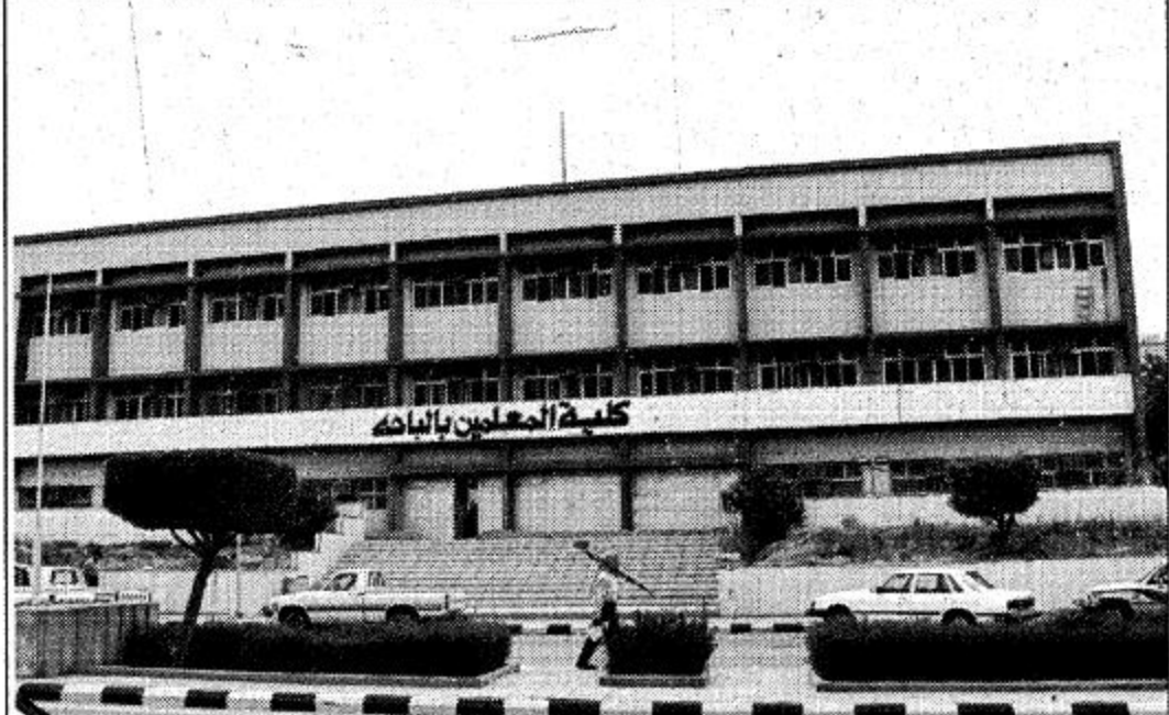
ويبلغ عدد الطلاب الدارسين ٧٢٠ طالباً للعام نفسه وتجري الدراسة في مستويات دراسية أما أقسام الكلية فهي قسم الدراسات القرآنية وقسم

إطلاقاً من حرص حكومة مولاي خادم الحرمين الشريفين على نشر العلم في مختلف مناطق المملكة وتسهيل مهمة الدراسة وتحصيل العلم لجميع أبناء هذا الوطن المعطاء فقد أنشئت كلية المعلمين في الباحة في ١٤٠٩ هـ ضمن ثلاث كليات أخرى اعتمدت أنشائها في كل من الباحة وعمره وجدة وذلك بهدف إعداد معلمين أكفاء للعمل بالمرحلة الابتدائية بما يتناسب مع حاجات المجتمع ومتطلباته ورفع مستوى تأهيل المعلمين القدامى وتجديد معلوماتهم ومفاهيمهم التربوية. وبدأت الكلية بالباحة بأحد عشر عضواً واستقبلت الكلية نفعها الأولى طالباً وبنات عام ١٤٠٩ هـ وكان مجموعهم ١٨٥ طالباً وتخرجت أول دفعة عام ١٤١٢ هـ واليوم وبنهاية عام ١٤١٨ هـ بلغ عدد خريجي هذه الكلية ٧٢٨ خريجاً