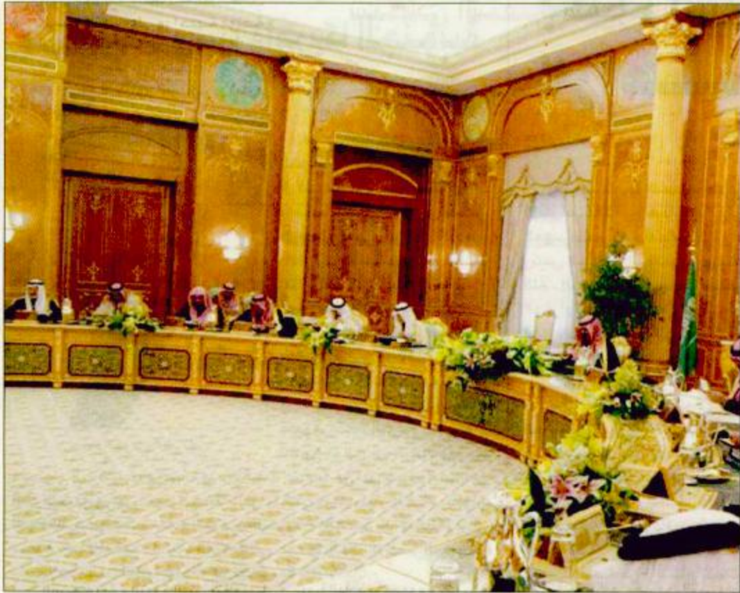
سمو ولي العهد مترئساً للجلسة