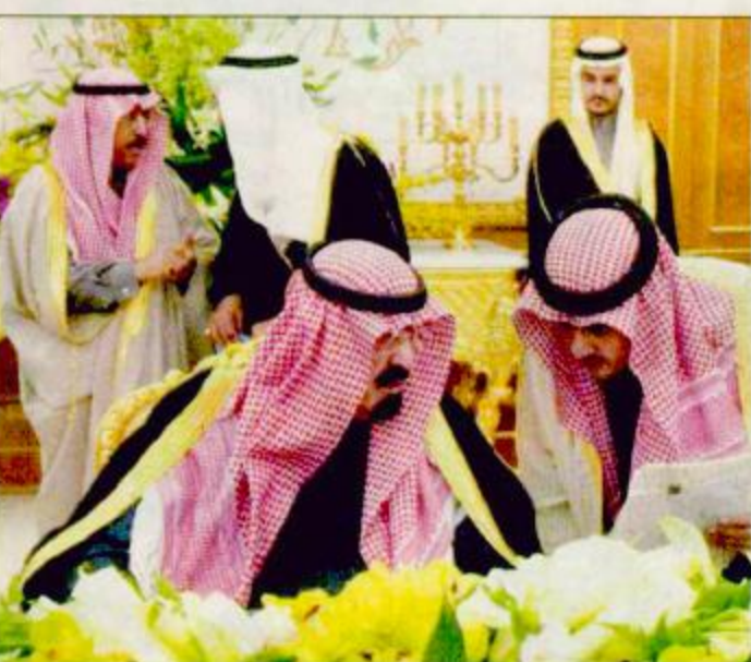
الأمير عبدالله لدى ترؤسه اجتماع مجلس الوزراء في الأراضي الفلسطينية. وأشار سموه الكريم إلى أن المباحثات تناولت ما يربط البلدين الشقيقين من علاقات وثيقة ورغبة الشقيقين في