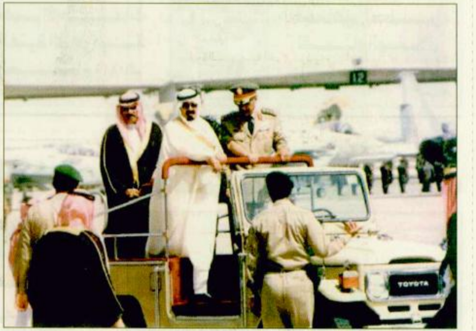
سمو ولي العهد تفقد قاعدة الملك عبدالعزيز ظهر امس

القاعدة لسمو ولي العهد برعا تكريماً بمناسبة زيارته التقنية للقاعدة.