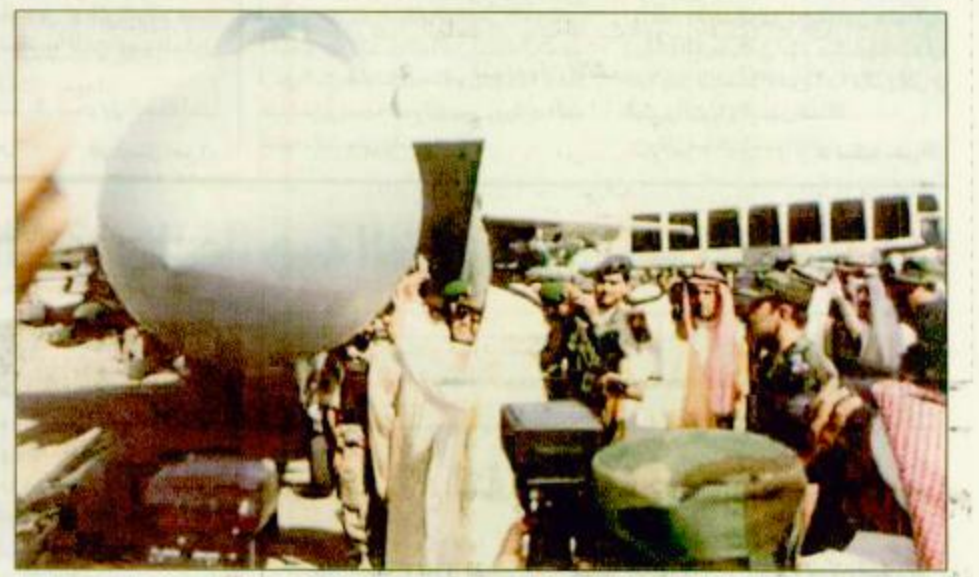
سموه تفقد الخشقة ف ١٥