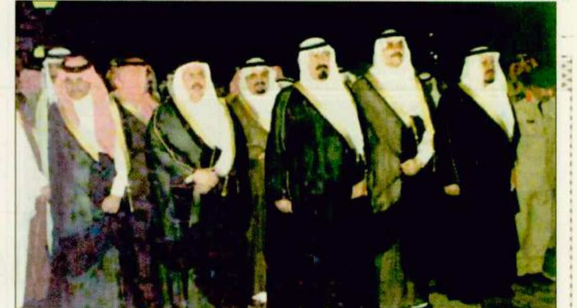
الخطاط بن زيارة سمو ولي العهد لجامعة الملك فهد

الملك فهد بن عبدالعزيز في استقبال سموه في مقره في الرياض، ورافق سموه في الزيارة معالي وزير الشؤون الاسلامية والاوقاف والدعوة والارشاد الدكتور عبدالله بن عبدالحسن التركي، وعدد من مسؤولي الوزارة، واعضاء مجلس الجمعية الخيرية لتحفيظ القرآن الكريم في المنطقة الشرقية. وخلال الزيارة التي رفقة فيها اصحاب السمو الملكي الامراء استمع سمو ولي العهد - ايه الله - الى شرح مفصل من معالي الدكتور عبدالله التركي عن محتويات المعرض، الذي ضم عدداً من الصور والخطاطات عن مناسك طقوس الصلاة في رباعيتها لميراث الله، وللشأن الوقفية والدعوة والارشادية للخشقة والنشرة داخل المملكة وخارجها. كما شاهد صاحب السمو الملكي الامير عبدالله بن عبدالعزيز صوراً لمركز الفرقان الذي انشاه الدكتور محمد بن تركي التركي على نفقته الخاصة، وخصصه للجمعية الخيرية لتحفيظ القرآن الكريم بالمنطقة الشرقية بقيمة تزيد عن ثمانية عشر مليون ريال.