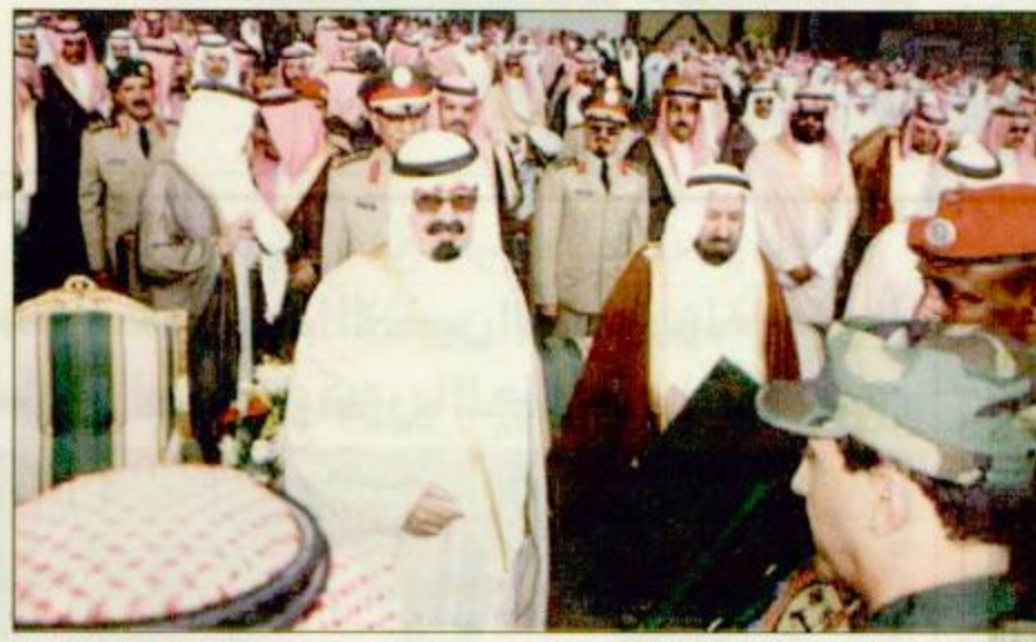
سموه يتسلم برعاً تكريماً