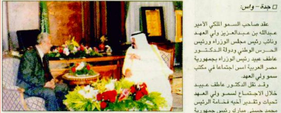
خادم الحرمين لدى استقباله رئيس الوزراء المصري ديوان رئاسة مجلس الوزراء ومعالي الأمير سعود بن فهد بن عبدالعزيز نائب رئيس الاستخبارات العامة وصاحب السمو الملكي الأمير عبدالعزيز بن فهد بن عبدالعزيز وزير الدولة وعضو مجلس الوزراء ورئيس