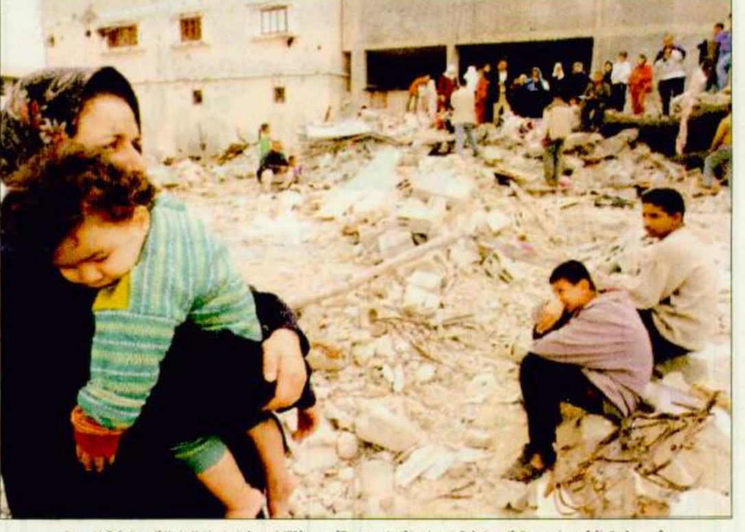
رفح - غزة (أ.ب): سيدة فلسطينية تحمل طفلها وهي تقف بين أنقاض منزلها والمنازل الفلسطينية المدمرة.

القدس - غزة - عمان - الوكالات: شنت طائرات حربية إسرائيلية عدواناً على مواقع إدارية سورية في عمق لبنان في ساعة متأخرة الليلة الماضية فيما وصفه الجيش الإسرائيلي بأنه رد على هجوم لرجال المقاومة أسفر عن قتل أحد جنوده. وهذا أول هجوم جوي إسرائيلي على موقع سوري منذ سحب إسرائيل قواتها من جنوب لبنان في مايو أيار الماضي. وقال الجيش في بيان أن طائرات حربية إسرائيلية هاجمت أهداف رادار تابعة للجيش السوري شمالي الطريق بين بيروت ودمشق رداً على الهجمات التي وقعت في الأونة الأخيرة. وقد تسبب العدوان الإسرائيلي في استشهاد جنديين سوريين وإصابة آخرين. من جهة أخرى توعدت حركة المقاومة الإسلامية «حماس» وجناحها العسكري أمس الأحد بالانتقام من إسرائيل لقتل أحد ناشطيها أمس أول السبت في غزة. وأكدت الحركة في بيان لها أن هذا التصعيد الإرهابي النوعي الإسرائيلي في استهداف المدنيين وترويع الأمن من الأطفال والشيوخ والنساء لن يمر دون عقاب ولن يفلت هذا العدو من الأخذ بالثأر ورد الصاع صاعين. وأشارت حماس إلى أن خطة شارون الإرهابي في مواصلة الاعتقالات وقصف البيوت وتجريفها لن تكسر إرادة شعبنا ولن توقف انتفاضته ومقاومته. وشيع الآلاف من انتصار حركة حماس أمس جثمان محمد ياسين نصار 24 سنة من حي الزيتون بمدينة غزة الذي قتل في انفجار دمر عشاء أمس الأول منزل عائلته وأصيب خلاله أيضاً أربعة أشخاص آخرين إثنان منهم أصابتهما خبطة أدهمها صبي في الثالثة عشرة.