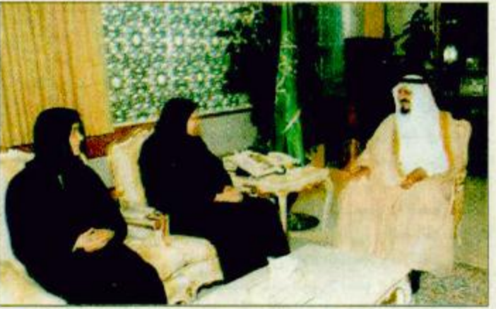
سمو النائب الثاني يستقبل د. ثريا عبيد - واس زيارة للمملكة العربية السعودية. وكان صاحب السمو الملكي الأمير سلطان بن عبدالعزيز النائب الثاني لرئيس مجلس الوزراء وزير الدفاع عاطف عبيد إلى جدة ظهر أمس في البقية ص 38

هنا ملكة الدنمارك خادم الحرمين يتلقى رسالة من مبارك