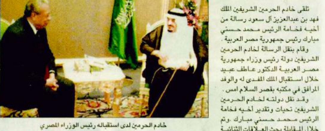
تلقى خادم الحرمين الشريفين الملك فهد بن عبدالعزيز آل سعود رسالة من أخيه فخامة الرئيس محمد حسني مبارك رئيس جمهورية مصر العربية. وقام بنقل الرسالة لخادم الحرمين الشريفين دولة رئيس وزراء جمهورية مصر العربية الدكتور عاطف عبيد خلال استقبال الملك المفدى له والوفد المرافق في مكتبه بصدر السلام أمس. وقد نقل دولته لخادم الحرمين الشريفين تحيات وتقدير أخيه فخامة الرئيس محمد حسني مبارك. وتم خلال المقابلة بحث العلاقات الثنائية بين البلدين الشقيقين وسبل دعمها وتعزيزها واستعراض شامل لجمال الأوضاع على الساحتين العربية والإسلامية والدولية.

تحت رعاية سمو ولي العهد الأمير سلمان يرعى غداً الاجتماعات المشتركة للهيئات المالية العربية