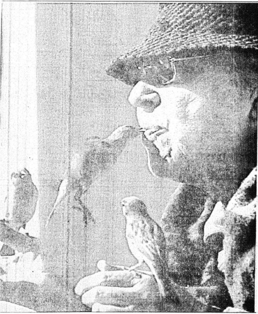
مؤيد - اساتينا - (أ ب) □ إحدى السيدات المسنات تقوم بتغذية أحد الصغار بقلبات الخبز من فها بينما يتفتقر عصافيران آخران دونها وذلك في بلايا أوربيتا بمدينة يوم الثلاثاء الماضي □

يذكر ان عدد المبعدين الفلسطينيين الموجودين الآن في مرج الزهور جنوب لبنان هو /٢٩٦/.