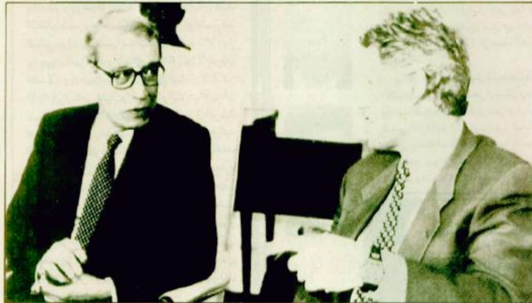
واشنطن - اب الرئيس كليفتون يتحدث في امين عام الامم المتحدة المختون بيرفس غالي خلال اجتماعها في المكتب للعدالة والادوية على شرفي الموسعة

الربيع يوقفون قوافل الاغاثة مرة اخرى كليفتون وغالي اتفقا على عملية انزال المون بالمظلات