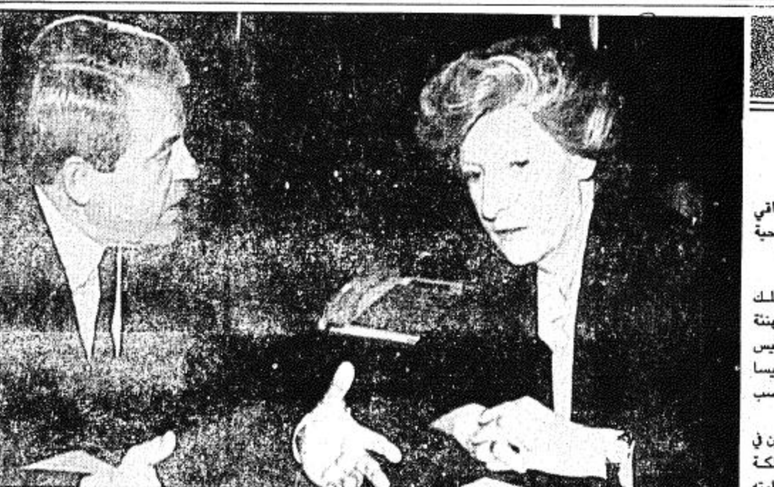
فيينا - النمسا - (أ ب) □ رئيسة الوزراء البولندية هانسا سوشكا والمستشار النمساوي فرانز فرانيسكي يناقشان بعض الأمور أثناء لقاءهما في فيينا يوم الثلاثاء الماضي حيث تقوم سوشكا بزيارة رسمية لمدة يومين للنمسا □