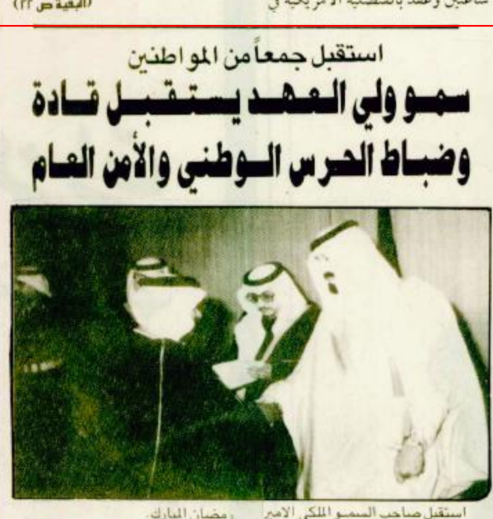
رمضان المبارك حضر الاستقبال طيقا لـ وواس معالي المستشار بالديوان الملكى الاستاذ ناصر الشنري. كما استقبل صاحب السمو الملكي الأمير (الرقبة ص ٢٢)