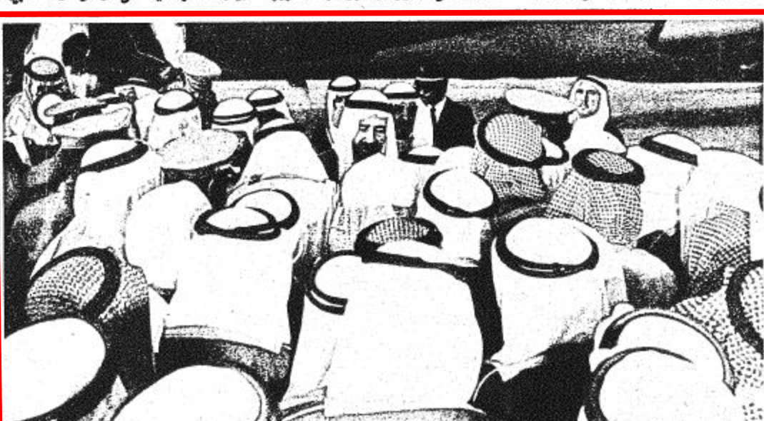
لقطة من وصول جلالة الى الطائف

في تمام الساعة الثانية عشرة والتفص من ظهر أمس بتوفيق إيران صاحب السمو الملكي الامير فهد بن عبد العزيز