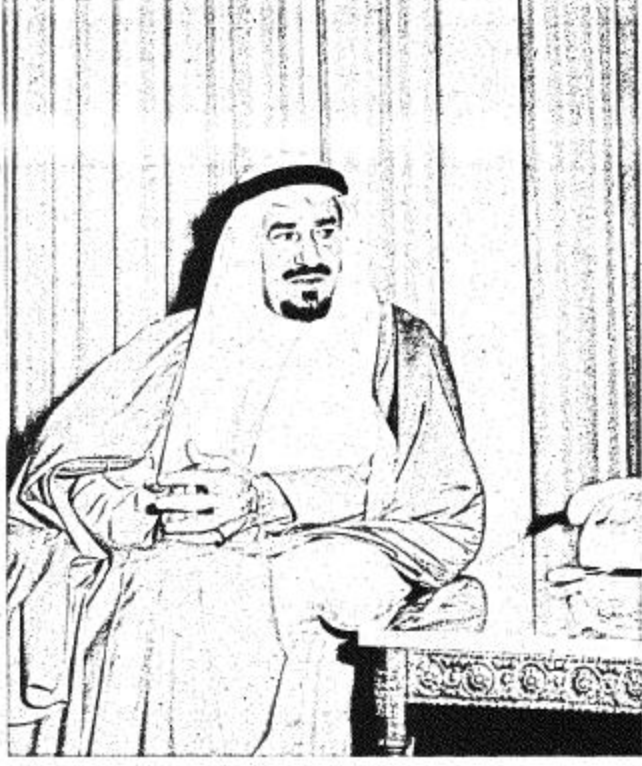
جلالة الملك خالد بن عبد العزيز