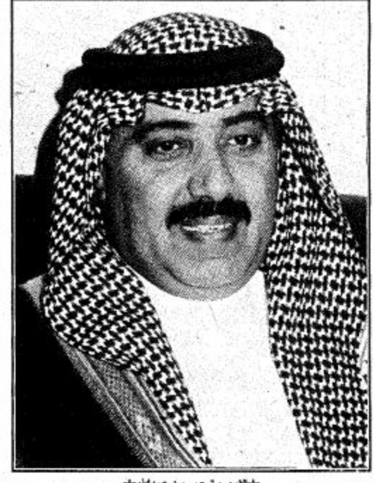
الأمير متعب بن عبد الله

الجنادرية: الجزيرة تحت رعاية صاحب السمو الملكي الأمير متعب بن عبد الله بن عبدالعزيز نائب رئيس الجهاز العسكري بالحرس الوطني قائد كلية الملك خالد العسكرية يقام في تمام الساعة السادسة