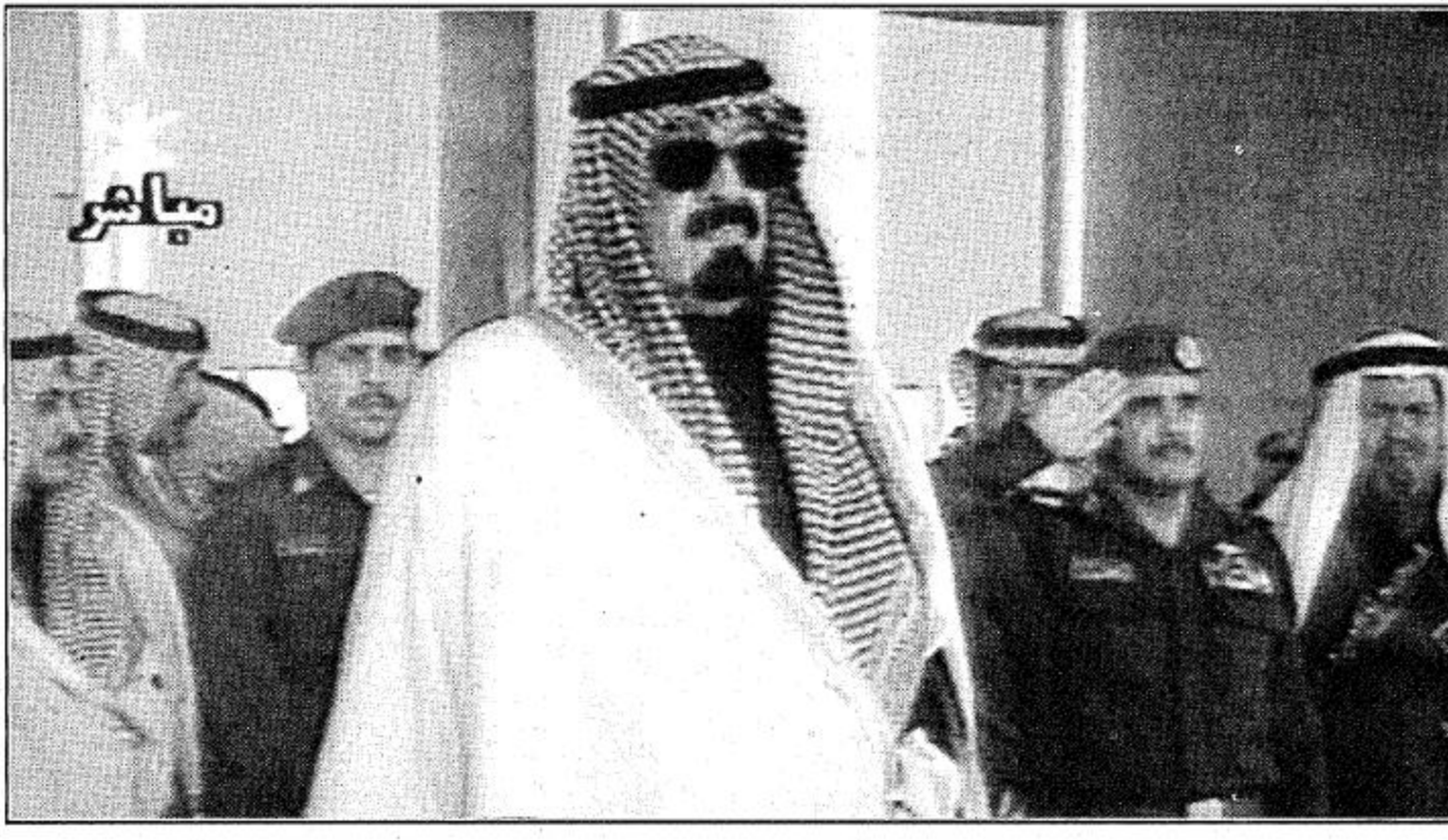
الولي العهد يسلم الجوائز للمراكز الأولى في سباق الهجن

الجنادرية - بعثة الجزيرة: نيابة عن خادم الحرمين الشريفين الملك فهد بن عبد العزيز آل سعود حفظه الله رعى صاحب السمو الملكي الأمير عبدالله بن عبدالعزيز ولي العهد نائب رئيس مجلس الوزراء ورئيس الحرس الوطني عصر أمس الأربعاء حفل افتتاح المهرجان الوطني الحادي عشر للتراث والثقافة الذي ينظمه الحرس الوطني سنوياً في الجنادرية. وبدأ حفل الافتتاح بسباق الهجن السنوي الكبير الساعة الرابعة والنصف عصراً وهو السباق الثاني والعشرون في تاريخ هذه السباقات حيث سلم صاحب السمو الملكي الأمير عبدالله بن عبدالعزيز الجوائز للمراكز الأولى في هذا السباق الذي اقيم على مضمار سباق الهجن بالجنادرية. وبدأ سباق الهجن السنوي الثاني والعشرون وسط جو جميل ربيعي تمتع ساهم في أضواء طابع الاثارة والتشويق ومتابعة السباق من قبل الجماهير الكبيرة التي تشعق هذا اللون من السباق وتستمتع به وساهم هذا الحضور ايضا في ادخال الحماس في نفوس المتسابقين منذ البداية وحتى النهاية. هذا وقد بلغت مسافة السباق 19 كلم وشارك فيه أكثر من ألف هجان وجاءت نتائجه كما يلي: