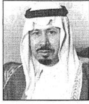
الأمير بدر متعب بن عبدالعزيز

صاحب السمو الملكي الأمير بدر بن عبدالعزيز نائب رئيس الحرس الوطني ورئيس اللجنة العليا لمهرجان الجنادرية للتراث والثقافة، سموه كان في غاية السورلية البارحة بتجاذب سباق الهجن الجماعي وتميز حفل الافتتاح الفني الكبير الجدير بالذكر سمو الأمير بدر عايش ميدانيا فترات الاستعداد لمهرجان الجنادرية (١١) كما هي عادة سموه كل عام وسامعت متابعته الميدانية في سهول مجريات الاستعداد وطلعت ابتداء معنوية وحافظ قويا لجميع العاملين في مهرجان الجنادرية لتقديم النجاح الذي تحققت أكبر مراحل نجاحه عصر أمس ومساء البارحة، سمو الأمير بدر بن عبدالعزيز تلقى سيلاً من التهاني والتبريكات بتجاذب حفل الافتتاح وسباق الهجن ولا يزال سموه يتابع ميدانيا فعاليات النشاط الثقافي التي تبدأ اليوم الخميس.