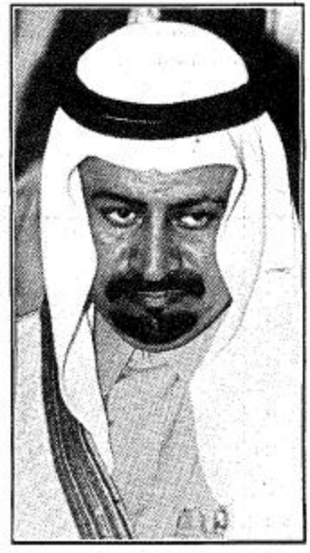
وزير الزراعة والمياه

عبر معالي وزير الزراعة والمياه الدكتور عبدالله بن عبدالعزيز للمعمر عن سروره البالغ لما شاهدته من اعداد جيد وترتيبات ترقى لاعلى المستويات في مهرجان الجنادرية الحادي عشر وقال معاليه ان هذا المهرجان يعد من تراث وثقافة المملكة العربية السعودية الذي نخبره ولا يد ان نحافظ عليه ونطوره. وواصل معاليه حديثه قائلاً ولا شك بأن تشريف صاحب السمو الملكي الأمير عبدالله بن عبدالعزيز لهذه المناسبة يزيد من أهميتها ويشرفها. وعن مشاركة الوزارة في هذا