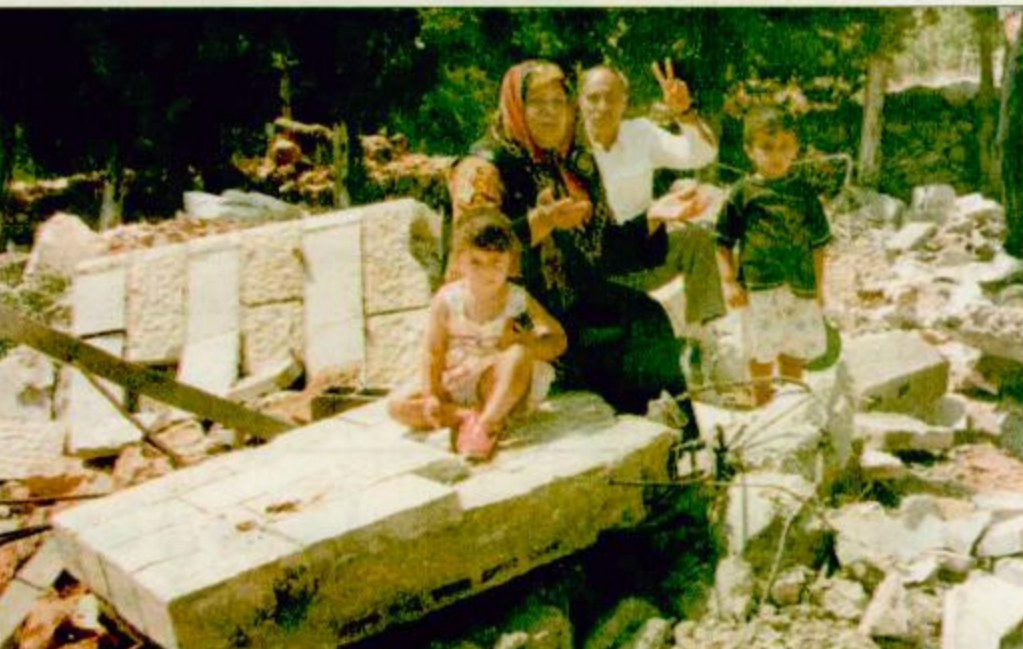
□ وفات الضفة الغربية - اف ب، عائلة فلسطينية تجلس بين حطام منزلها يوم الثلاثاء الماضي في قرية وقات الغربية من وادها بالضفة الغربية. السلطات الإسرائيلية دمرته بالمبارزة بجحة البناء دون ترخيص.

الحسن الثاني افتتح أعمال لجنة القدس وعرفات عرض تفاصيل الأوضاع