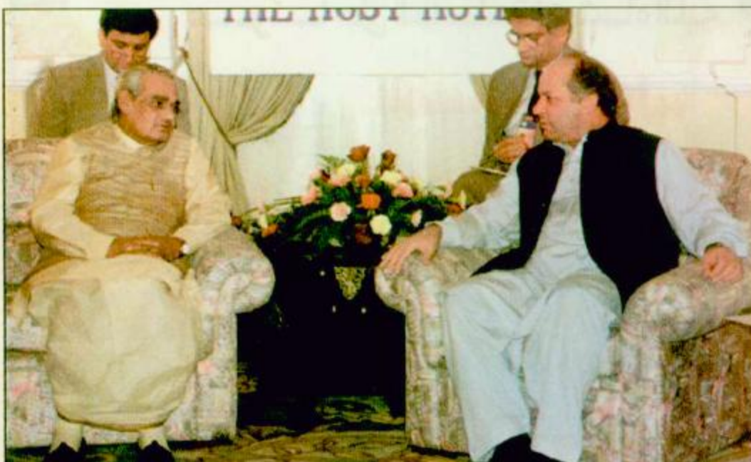
□ كولومبو - سيولتا، اف ب، رئيس الوزراء الهندي اتان بيهاري فاجباني (يسار) يجتمع مع نظيره الباكستاني نواز شريف امس على هامش قمة القناعون الاقليمي لرابطة دول جنوب اسيا SAARC المنعقدة في كولومبو لمدة ثلاثة ايام. وهو اول لقاء بين الزعيمين منذ تجاريهما الفرية في مايو الماضي.

نيودلهي تعلن التزام بلادها بنزع السلاح النووي باكستان عرضت استئنافاً فورياً للمحادثات مع الهند بعد لقاء الزعيمين