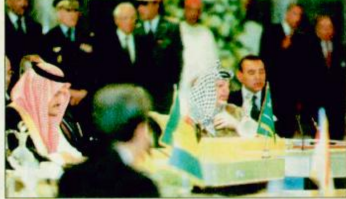
الثلاثاء الخامس من ربيع الثاني ١٤١٩ هـ للاوق للشاؤون والعشريين من شهر يوليو ١٩٩٨ محضر الاتفاق التالي نصه: انطلاقاً من معاهدة الطائف ومكثرة التقادم وتأكيداً للرغبة البقية ٢٥ ص

الجامعة العربية والصحف اليمنية تبرزان زيارة الأمير سعود الفيصل القاهرة - صنعاء - واس، اشاد الامين العام لجامعة الدول العربية الدكتور عصمت عبدالجديد بالحكمة التي تحلت بها كل من الملكة العربية السعودية والجمهورية اليمنية في معالجة حادث جزيرة الدويرة.