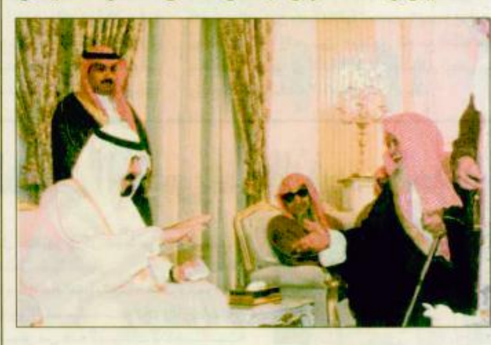
□ الطائف - واس، اجرى صاحب السمو الملكي الامير عبدالله بن عبدالعزيز ولي العهد نائب رئيس مجلس الوزراء ورئيس الحرس الوطني اتصالاً هاتفياً مساء أمس مع جلالته الملك الحسين بن طلال الملكة الاردنية الهاشمية للاطمئنان على صحته جلالته. وقد طمأن جلالته الملك الحسين سموه على صحته وتذكره على اتصاله من جانبه تمنى سموه ولي العهد لجلالته ان يسبح الله عليه لياس الصحة وان يعيده الى بلاده في أقرب وقت متمنياً بالصحة. البقية ٢٥ ص

سمو ولي العهد اطمأن على صحة الملك حسين واستقبل جموعاً من المواطنين