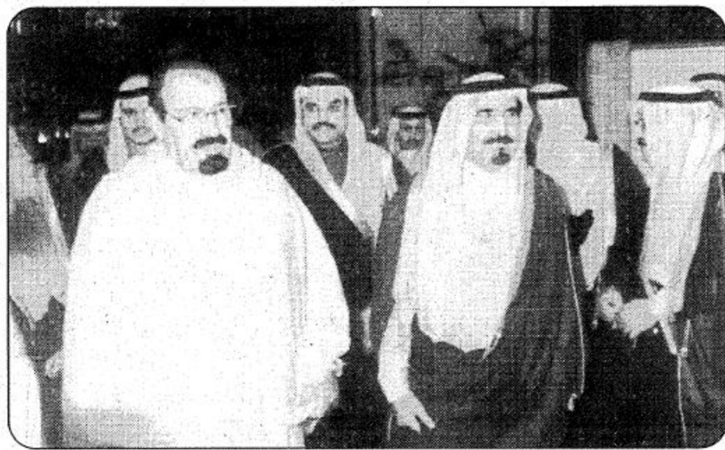
○ لحظة لوصول سمو ولي العهد إلى جدة ○ الصورتان من واس