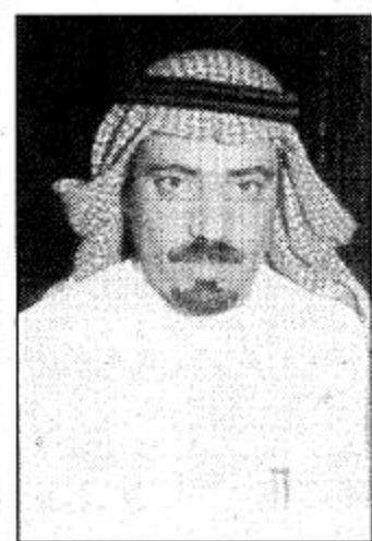
○ رئيس بلدية القويعة