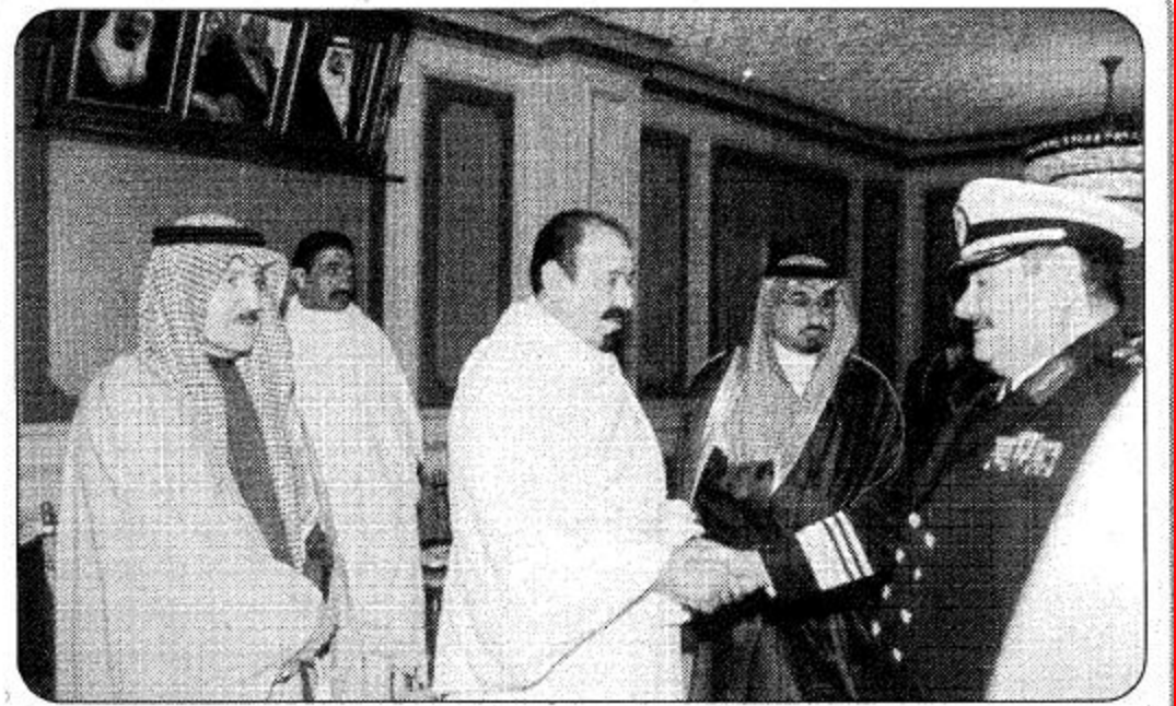
○ لحظة لخادعة سمو ولي العهد الرياض متوجها إلى مكة المكرمة أداء مناسك العمرة