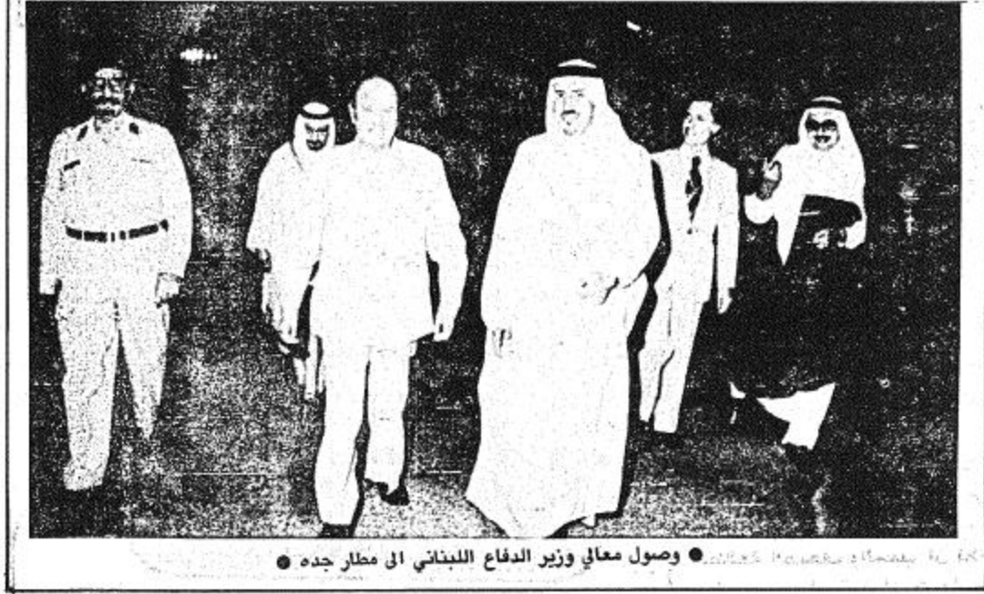
وصول معالي وزير الدفاع اللبناني الى مطار جدة ●

الباحة بهذه المنطقة. واختتم تصريحه قائلاً انه يوجد بالمنطقة حوالي ٢٠٠ مدرسة مختلف المراحل توجد فيها ٦٨ مدرسة في مبنى حكومي والبقية في مباني مستأجرة.