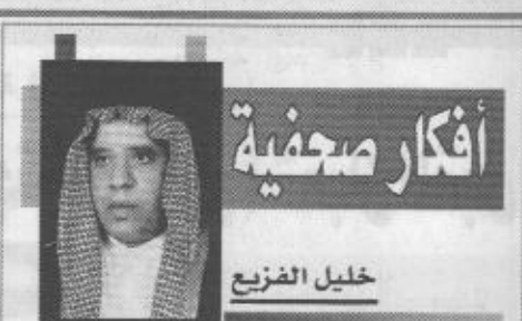
أفكار صحفية خليل الفريخ

الرياض / واس تلقى خادم الحرمين الشريفين الملك فهد بن عبدالعزيز آل سعود حفظه الله مزيدا من بركات التهنة بمناسبة ذكرى اليوم الوطني للمملكة من أصحاب الجلالة والفخامة والسمو ملوك ورؤساء وأعضاء الدول العربية والإسلامية والصدقية وهم فخامة الرئيس ادواردو دو الديو رئيس جمهورية الأرجنتين فخامة الرئيس اسلام كريموف رئيس جمهورية أوزبكستان فخامة الرئيس يوري ك موسغين رئيس جمهورية أوغندا فخامة الرئيس بريز بلكيتش رئيس مجلس الرئاسة (اليومسة والهندس) فخامة الرئيس صفور مراد تركمانباشي رئيس جمهورية تركمانستان فخامة الرئيس فستلاف هافل رئيس الجمهورية التشيكية فخامة الرئيس ياسر عرفات رئيس دولة فلسطين فخامة الرئيس عثمان غزالي رئيس جمهورية القمر المتحدة فخامة الرئيس دانيال أرب موي رئيس جمهورية كينيا