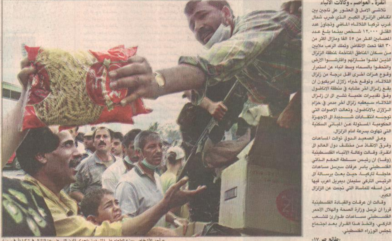
أحد الأشخاص يوزع الطعام على المشردين بأحدى المدن التي ضربها الزلزال في تركيا

استقبل بشار الأسد أمير البحرين يتسلم رسالة من عبدو ضيوف المنامة، ق.ن.ا تسلم سمو الشيخ حمد بن عيسى آل خليفة أمير دولة البحرين رسالة من الرئيس السنغالي عبدو ضيوف تتناول العلاقات القائمة بين البلدين وسبل تعزيزها في كافة المجالات إضافة الى القضايا ذات الاهتمام المشترك. وقام بتسليم الرسالة السيد عثمان تاور ديانج وزير الخدمات وشؤون رئاسة الجمهورية الامين العام للحزب الحاكم ميعوث الرئيس السنغالي خلال استقبال سمو أمير دولة البحرين له امس.. حيث تم كذلك بحث مختلف مجالات التعاون والمستجدات على الساحتين العربية والافريقية. وكان المبعوث السنغالي الذي يزور المنامة حالياً قد اجتمع مع سمو الشيخ خليفة ابن سلمان آل خليفة رئيس وزراء البحرين صباح امس وجرى بحث مجالات التعاون بين البلدين وتبادل الآراء حيال القضايا والمستجدات الراقعة على الساحتين الاقليمية والدولية. من جهة ثانية استقبل سمو الشيخ حمد بن عيسى آل خليفة وسمو الشيخ سلمان بن حمد آل خليفة ولي العهد القائد العام لقوة الدفاع اسس العقيد الركن بشار حافظ الأسد الذي يزور البحرين حالياً وقد عبر سمو أمير البحرين خلال المقابلة عن تقديره لل دور الكبير الذي يضطلع به الرئيس حافظ الأسد على الصعيدين الاقليمي والدولي والجهود التي تبذلها لدعم التضامن العربي والعمل على دفع مسيرة السلام في الشرق الاوسط.