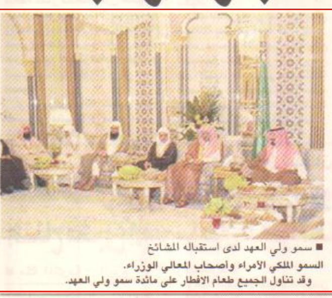
سمو ولي العهد لدى استقباله المشايخ سمو الملكي الأمراء وأصحاب المعالي الوزراء. وقد تناول الجميع طعام الإفطار على مائدة سمو ولي العهد.

السفير عاشور د. اليوم : لم يعتقل أي سعودي بعد انفجار مومباسا