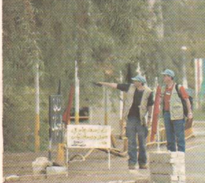
موقع على بعد ٧٠ كيلومترا شمال بغداد متهمة بتخزين أسلحة

للدمار الشامل في العراق. وكالعادة قام المفتشون بإبعاد الصحفيين الذين راقبوا الموقف من وراء سياج ولكن فيما يبدو أنهم قد كشفوا عن وجود أسلحة محظورة (اليوم) ان وجود المقاتلين على أرض العراق يمثل فرصة خطيرة للعراق للكشف بالذکر ان هذه القاعدة الصغيرة التي تبعد ٧٠ كيلومترا شمال بغداد سنوات عديدة