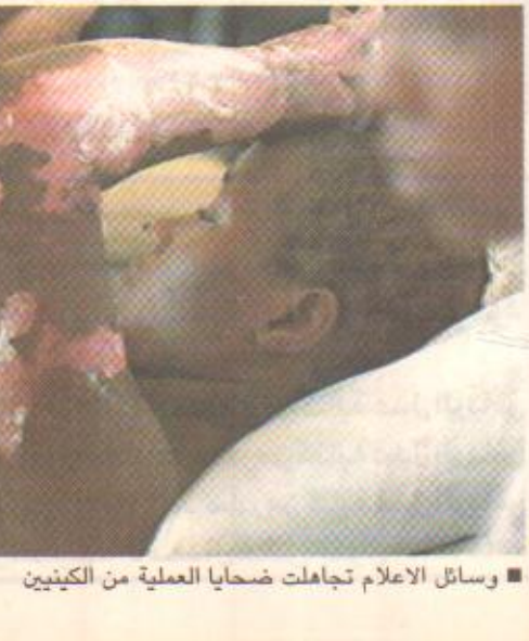
وسائل الاعلام تجاهلت ضحايا العملية من الكيتيين