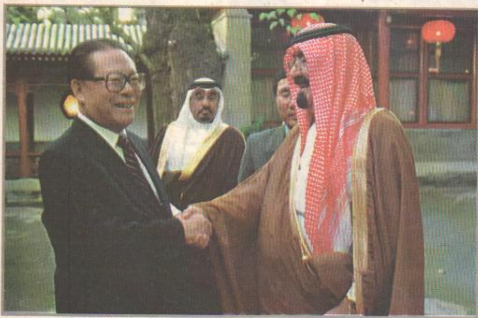
سمو ولي العهد مع الرئيس الصيني في بكين

اللجنة المشتركة وعلى هامش زيارة الرئيس الصيني إلى المملكة تجتمع اللجنة السعودية الصينية المشتركة برئاسة وزير التجارة في البلدين ويتوقع ان تقر عدا من الاتفاقيات بشأن تطوير العلاقات الاقتصادية والاستثمارية والتقنية والبيروية . ورغم ان حركة التبادل التجاري بين السعودية والصين شهدت تصاعدا في السنوات الأخيرة فان البلدين يرغبان في