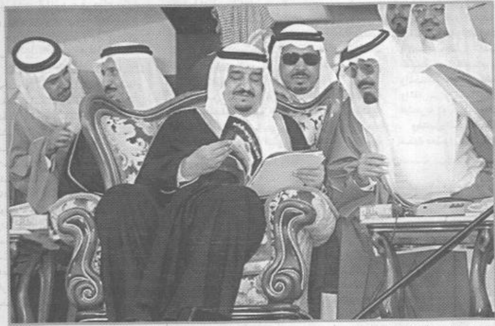
هذه العام. لهذا العام.

الكراسي وحرك تيلش، وستعرض هذه المسرحيات ابتداء من يوم غد الخميس في كل يوم مسرحية وحتى يوم الجمعة بعد القادم، وستقام العروض المسرحية على مسرح معهد أعداد المربين التابع للمؤسسة العامة للتعليم الفني والتدريب المهني، وسيتم عرض الفنون التشكيلية بمشاركة عدد من الفنانين، ومن المتوقع أن يكون أكبر معرض منظم لعاملين الفنانين التشكيليين السعوديين.