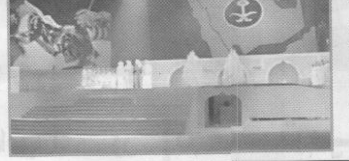
١١ إصداراً وثائقياً وسيصنر المهرجان هذا العام عدداً من المطبوعات، هي: عرض إصدارات المهرجان خلال ١٠ سنوات، المهرجان