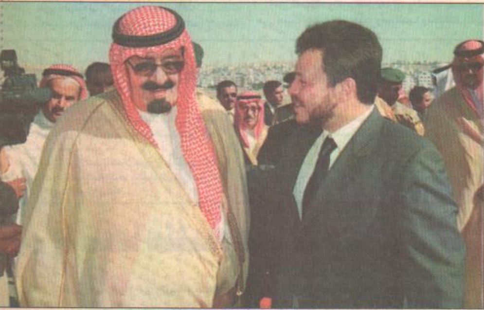
عامل الأردن في مقدمة استقبال الأمير عبدالله

الخطيب ومعالى وزير الإعلام والثقافة ناصر اللوزي ومعالى وزير الداخلية شايب القاضي ومعالى وزير الرياضة والشباب الدكتور محمد خير ماسر ومعالى وزير الصناعة والتجارة محمد عصفور ومدير المخابرات العامة الفريق مسيح البطيحي والسفير الأردني لدى المملكة العربية السعودية هاشم خلفه. وفي وقت لاحق قام جلالة الملك عبدالله بن الحسين بحل عشاء تكريما لضيف الأردن الكبير وذلك في قصر بسمان حضره الوفد المرافق.