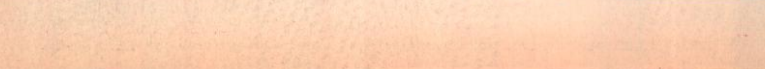
تشيرنوميردين المبعوث الروسي إلى البلقان «يمين» وعضيفه الأوروبي الرئيس الفيلقندي مارتي اغتيساري لدى وصولهما إلى بلغراد امس «اليسار»