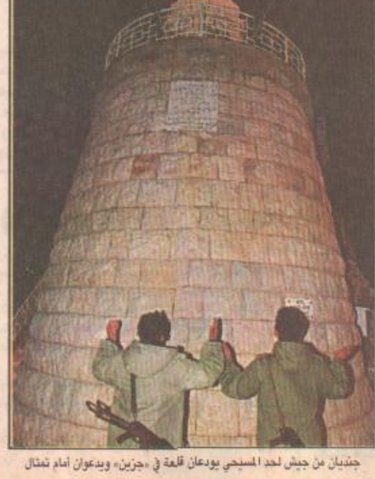
جنتيان من جيش لحد المسيحي يودعان لغة في «جزين» ويعدان أمام تمثال

المانيا/ بلغراد / وكالات الأنباء أعلنت المتحدة باسم الحكومة الألمانية أو-كارستن هاي امس الخميس أن المبعوثين الأوروبي والروس حول كوسوفا اتفقا على هيكلة لقيادة مشتركة للقوة الدولية المستقبلية التي ستتمم قوات دولية مع الحلف الأطلسي كتواء. وفي تطور لاحق أكدت مصادر برلمانية أن البرلمان الصربي وافق امس الخميس على خطة للسلام في كوسوفا قدمها الوفد الأوروبي ورئيس الفيلقندي سارتي اغتيساري والوفد الروسي فيكتور تشيرنوميردين إلى الرئيس اليوغوسلافي سلوبودان ميلوسيفيتش. وأيد ١٣٦ نائبا الخطة مقابل ٧٤ رفضوها من أصل ٢٥٠ نائبا في حين امتنع أربعة عن التصويت وغاب ٣٦ نائبا.