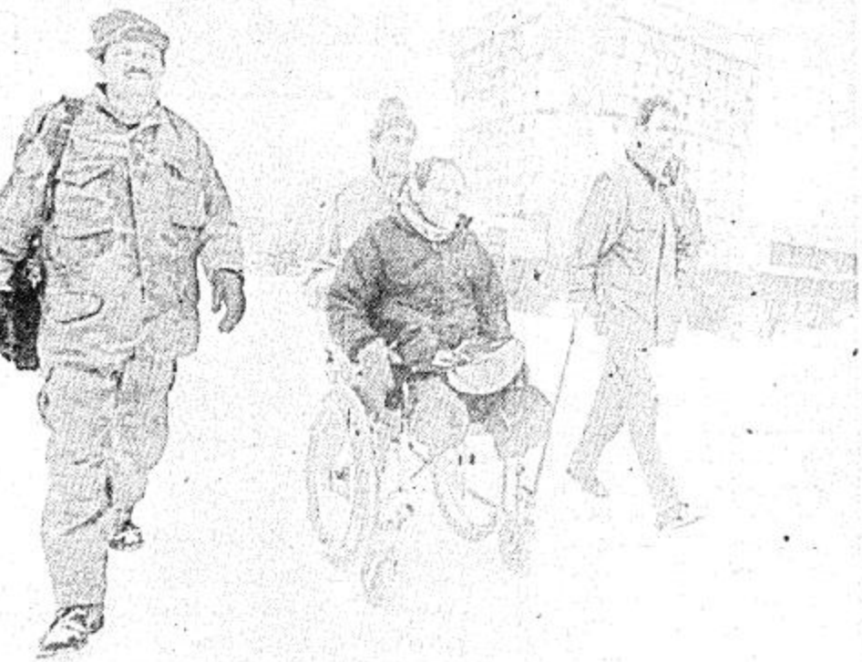
سراييفو - البوسنة أ. ب. ثلاثة من ضحايا حرب البوسنة يسيرون بواسطة اطراف صناعية ويدفعون اسماهم على كرسي متحرك ذي عجلات زميل لهم فقد سلبه يسيرون في احد طرق الموت المعروف باسم «ممر القصف».