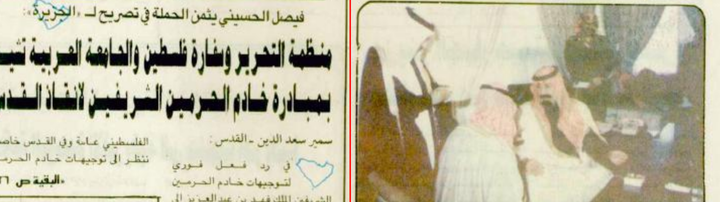
استقبل صاحب السمو الملكي الامير عبدالله بن عبدالعزيز في العهد واثبت رئيس مجلس الوزراء ورئيس المجلس الوطني في مكتب سموه بزيارته الحرس الوطني انس جعفا من المواطنين الذين

الذي يقابلون حكومة البوسنة ذات الغالبية المسلمة قال الرئيس البوسني ان على الكروات ان يرحلوا والا سيتم ضون لعقوبات ويشار الى ان حدة المعارك بين البوسنة وكروات