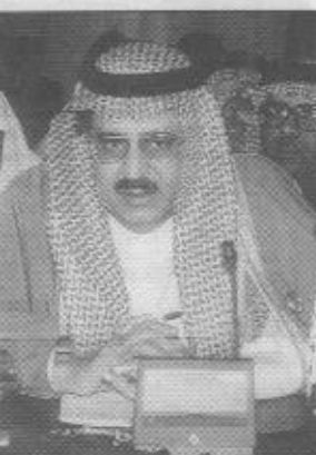
الامير نايف بن عبدالعزيز

الرياض/ واس تلقى صاحب السمو الملكي الامير نايف بن عبدالعزيز وزير الداخلية المشرف العام على اللجنة السعودية لآغاثة الشعب الافغانى رسائل من كل من رئيس جنوب غرب أفغانستان والى قندهار حاجي قل أعبا شيرزى ورئيسي المهاجرين بولاية قندهار عبدالمجيد هاشمي وبوظاف لدى شركات ومدير جامعة أحمد شاه الثانوية عبدالباري سوسن أعربوا من خلالها عن عظيم شكرهم وعميق تقديرهم للجهود الاغاثية التي تبذلها الملكة تجاه أبناء الشعب الافغانى المسلم في هذه الظروف الصعبة من تاريخه والتي تقوم بها اللجنة السعودية لآغاثة الشعب الافغانى بأشراف صاحب السمو الملكي الامير نايف بن عبدالعزيز وزير الداخلية سائلي الله العلي القدير أن يجزل لسموه الاجر والثوبة لما يقوم به من جهود في خدمة الاسلام والمسلمين. وقد شكرهم سموه على ما تضمنته رسائلهم من مشاعر