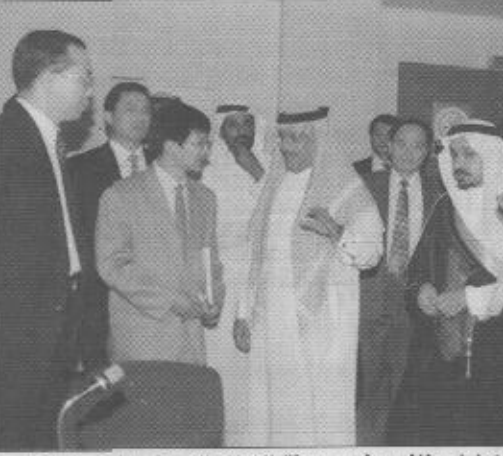
من مناشط وزيارات نائب رئيس هيئة الاعلام الصينى داخل الملكة