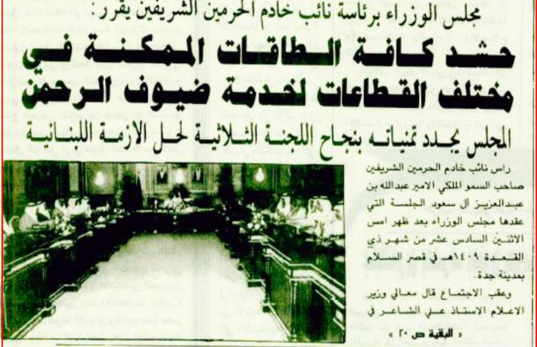
راس نائب خادم الحرمين الشريفين صاحب السمو الملكي الأمير عبدالله بن عبدالعزيز آل سعود الجلسة التي عقدها مجلس الوزراء بعد ظهر أمس الاثنين السادس عشر من شهر ذي القعدة ١٤٠٩هـ في قصر السلام بمدينة جدة.

مجلس الوزراء برئاسة نائب خادم الحرمين الشريفين يقرر: حشد كافة الطاقات الممكنة في مختلف القطاعات لخدمة ضيوف الرحمن المجلس يجدد تميّنه بنجاح اللجنة الثلاثية لحل الأزمة اللبنانية