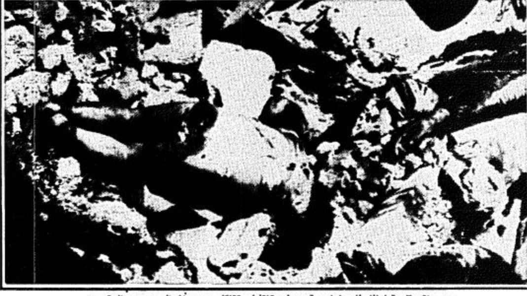
جثة مقبولة لطل فلسطيني وقد بدأت تنتفخ وتتآكل ويبدو آل اليمين يد والدته

بيروت - الوكالات.. بدأ واضحا ان اسرائيل لم تستطع التوفيق بين اهدافها الدخية وحججها المخلتة في لبنان. فعندما اجتاححت قواتها بيروت الغربية في اعقاب اغتيال الرئيس اللبناني المنتخب بشير الجميل قالت اسرائيل انها دخلت بيروت بحجة حفظ الامن.. ولكنها اليوم وهي تتراجع امام الضغط العالمي من اجل سحب قواتها عن بيروت بدأت تتكلم في تسليم النقاط الحساسة لافراد الجيش اللبناني.. وقد وقعت مصادمات كثيرة بين افراد الجيش اللبناني التي شرعت في الانتشار في بيروت الغربية وقوات اسرائيل التي تحتل القطاع الغربي. وبعد تحول في السياسة الامريكى. وتده العاهل الاردني بالجزيرة التي ارتكبتها اسرائيل بحق المدنيين الفلسطينيين في بيروت وطالب المجتمع الدولي بالتحرك لوقف هذه الانتهاكات الاسرائيلية لحقوق الانسان. ومن جهة اخرى توقف العمل في الاردن ظهر اس لمدة نصف ساعة حدادا على ارواح ضحايا المذبحة الاسرائيلية في بيروت واستجابة لنداء منظمة التحرير الفلسطينية. عما - واس: دعا الملك حسين عامل الاردن منظمة التحرير الفلسطينية الى الدخول في حوار مع الاردن لصياغة تصور للعلاقات التي يمكن ان تقوم بين الكيان الفلسطيني والاردن على صيغة اتحاد. وقال في اجتماع ضم مختلف الفئات والهيئات الشعبية والرسمية الاردنية اليوم ان الوقت قد حان للدخول في هذا الحوار مع المنظمة باعتبارها الممثل الشرعي الوحيد للشعب الفلسطيني من منطلق التمسك بحق تقرير المصير الحر للفلسطينيين واللبنانيين. وأكد الملك حسين متمسكاً بإداه بالفضية الفلسطينية باعتبارها قضية اردنية فلسطينية قبل ان تكون عربية وقال ان الاردن لن يسمح لاحد في العالم بان يتدخل في القضية.