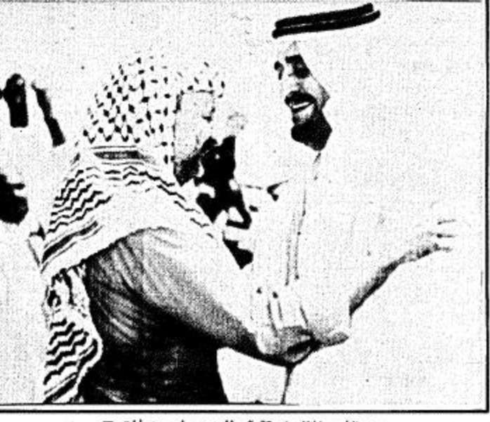
الفهد اثناء استقباله للسيد ياسر عرفات