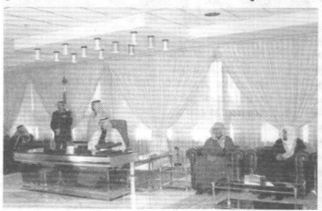
وقادة وضباط الحرس الوطني والدفاع المدني وجموعا من المواطنين صاحب السمو الملكي الأمير نواف بن عبدالعزيز والسفير الأمريكي. وقد تناول الجميع طعام الغداء على مأدعة سمو ولي العهد، بعد ذلك عقد سموه مع السينااتور ليرمان اجتماعا جرى خلاله استعراض مجمل الأحداث الدولية الراهنة وحضره سمو ولي عبدالله بن عبدالعزيز