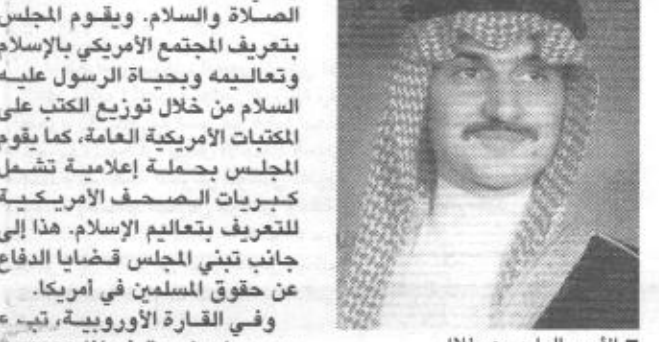
الأمير الوليد بن طلال يتبرع بصندوق «بوش الأب» للمناهج التعليمية، وهو صندوق أمريكي، الذي يرأسه صاحب السمو الملكي الأمير تشارلز ولي العهد البريطاني، ويمبلغ مليون دولار أمريكي وذلك خلال لقائهما في قصر سينت جيمس في واشنطن، في ١٠ من شهر يونيو ٢٠٠٢م. كما تبرع سموه بمبلغ ١٠ ملايين دولار لصالح جمعية فيجن Vision ٩٧ للتشجيعية مساهمة ما سموه في دعم البرامج الثقافية والخيرية للجمعية بجمهورية التشيك والتي تترأسها السيدة العاشم الأولى السيدة داجملا هافوفا

التبرع السخي لدعم الصندوق، مؤكداً بأن برنامج تقديم المنح سيبدأ مع حلول الذكرى المائتين والخامسة والعشرين للاكاديمية، كما شملت الرسالة دعوة رسمية للأمير الوليد لزيارة الأكاديمية والإطلاع على نشاطاتها. تبرع صاحب السمو الملكي الأمير الوليد هذا يأتي ضمن عدة تبرعات وبرامج يتبناها سموه من أجل إيجاد آلية للتواصل ورباب الصداق بين العالمين العربي والغربي وحضاراتهما، وبالأخص في الفترة الأخيرة مما يتطلب مواجهة حقيقية لكل ما يروج عن العرب والمسلمين في الغرب، والأمير الوليد عمل وما زال يعمل على تقريب وجهات النظر بين العالمين الإسلامي والغربي من خلال فتح قنوات الحوار والعمل المشترك في البرامج الثقافية والاجتماعية، والإنسانية لنقل صورة جديدة إلى المواطن العادي في العالم الغربي. ومن ضمن التبرعات التي ساهم بها الأمير الوليد في هذا الصدد تبرع سموه بمليون دولار لصندوق المبادرة الثقافية العربية بالجامعة العربية التي أسس للعمل على تحسين صورة العرب والمسلمين