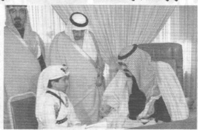
صاحب السمو الملكي الأمير عبدالعزيز ابن عبدالله بن عبدالعزيز المستشار في ديوان سمو ولي العهد وصاحب السمو الملكي الدكتور بندر بن سلمان بن محمد آل سعود المستشار في ديوان سمو ولي العهد وصاحب السمو الملكي الأمير سعود بن عبدالله بن عبدالعزيز