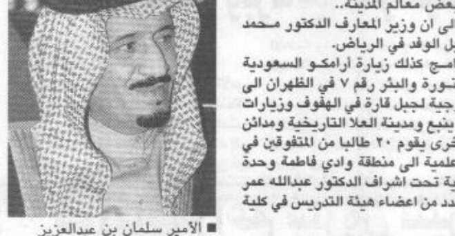
الأمير سلمان بن عبدالعزيز

وجودهم في جدة برصد كوكبي المشتري والمريخ من كلية العلوم الفلكية بجامعة الملك عبدالعزيز ويقوم الوفد بزيارات ميدانية لبعض معالم المدينة. وأشار نصيف إلى أن وزير المعارف الدكتور محمد أحمد الرشيد استقبل الوفد في الرياض. ويتضمن البرنامج كذلك زيارة أرامكو السعودية بالشرقية ورأس تنورة والبئر رقم ٧ في الظهران التي جانب رحلة جيولوجية لجبل قارة في الهفوف وزيارات أخرى إلى صناعية بنبع ومدينة العلا التاريخية ومدائن صالح. من جهة أخرى يقوم ٢٠ طالباً من المتفوقين في جدة مكة برحلة علمية إلى منطقة وادي فاطمة وحرة وأم السلم والحديبية تحت إشراف الدكتور عبدالله نصيف ومشاركة عدد من أعضاء هيئة التدريس في كلية علوم الأرض.