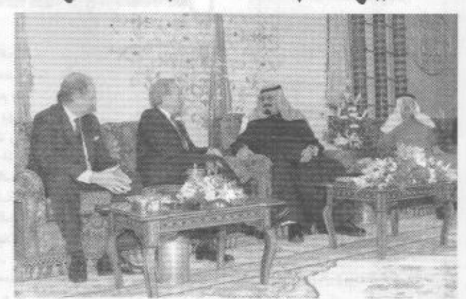
السناطور جوزيف ليرمان، وحضر الاستقبال صاحب السمو الملكي الأمير نواف بن عبدالعزيز رئيس الاستخبارات العامة وصاحب السمو الملكي الأمير خالد بن فيصل بن تركي ابن عبدالعزيز وصاحب السمو الملكي الأمير الوليد بن طلال بن عبدالعزيز