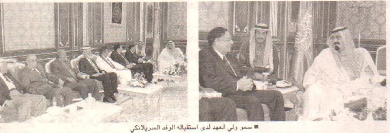
سمو ولي العهد لدى استقباله الوفد السريلانكي

وبين الدكتور خالد السبيتي أن محور الخطة لتقنية المعلومات تشمل الثقافة والتعليم والتجارة والاقتصاد والإدارة والخدمات والاتصالات وأمن المعلومات وموضعا أنه يراعى في اختيار أعضاء المشروع تنوع الخلفيات والخبرات والعلاقة الوثيقة بالمشروع الذي يبلغ عدد أعضائه خمسة وسبعين عضوا. وأفاد أن المشروع يمر بثلاث مراحل أولاها دراسة التجارب الدولية ومستجدات التقنيات الحديثة في الوضع الراهن الحالي أما المرحلة الثانية فهي اعداد الخطة وآليات ومتابعة التنفيذ والرحلة الثالثة مرحلة التنفيذ. وقد حث صاحب السمو الملكي الأمير عبدالله بن عبدالعزيز الجميع على مواصلة العمل بجد واجتهاد لتحقيق النتائج المرجوة من هذا المشروع مؤكدا سموه أهمية تقنية المعلومات في هذا العصر وضرورة الاستفادة منها في كافة مناحي الحياة. وأكّد سمو ولي العهد حرص حكومة