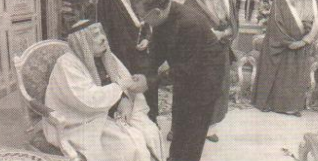
استقبل خادم الحرمين الشريفين الملك فهد بن عبدالعزيز آل سعود في مكتبه بصدر البعثة في الرياض أمس رئيس البرلمان سريلانكا جوزيف مايكل بيريرا برفقة معالي وزير العمل والتوظيف ماهيندا سامار ومعالي وزير تطوير المنطقة الغربية في سريلانكا محمد حنيفه محمد ومعالي وزير الشؤون البرلمانية عبدالحميد أزرو وأعضاء وفد البرلمان الذين يزورون المملكة حاليا.

استقبل خادم الحرمين الشريفين الملك فهد بن عبدالعزيز آل سعود في مكتبه بصدر البعثة في الرياض أمس رئيس البرلمان سريلانكا جوزيف مايكل بيريرا برفقة معالي وزير العمل والتوظيف ماهيندا سامار ومعالي وزير تطوير المنطقة الغربية في سريلانكا محمد حنيفه محمد ومعالي وزير الشؤون البرلمانية عبدالحميد أزرو وأعضاء وفد البرلمان الذين يزورون المملكة حاليا. حضر الاستقبال صاحب السمو الملكي الأمير أحمد بن عبدالعزيز نائب وزير الداخلية وصاحب السمو الملكي الأمير سعود بن فهد بن عبدالعزيز نائب رئيس الإختيار العامة وصاحب السمو الملكي الأمير عبدالعزيز بن فهد بن عبدالعزيز وزير الدولة وعضو مجلس الوزراء رئيس ديوان رئاسة مجلس الوزراء ومعالي رئيس مجلس الشورى الشيخ الدكتور صالح بن حميد ومعالي رئيس الديوان الملكي الأستاذ