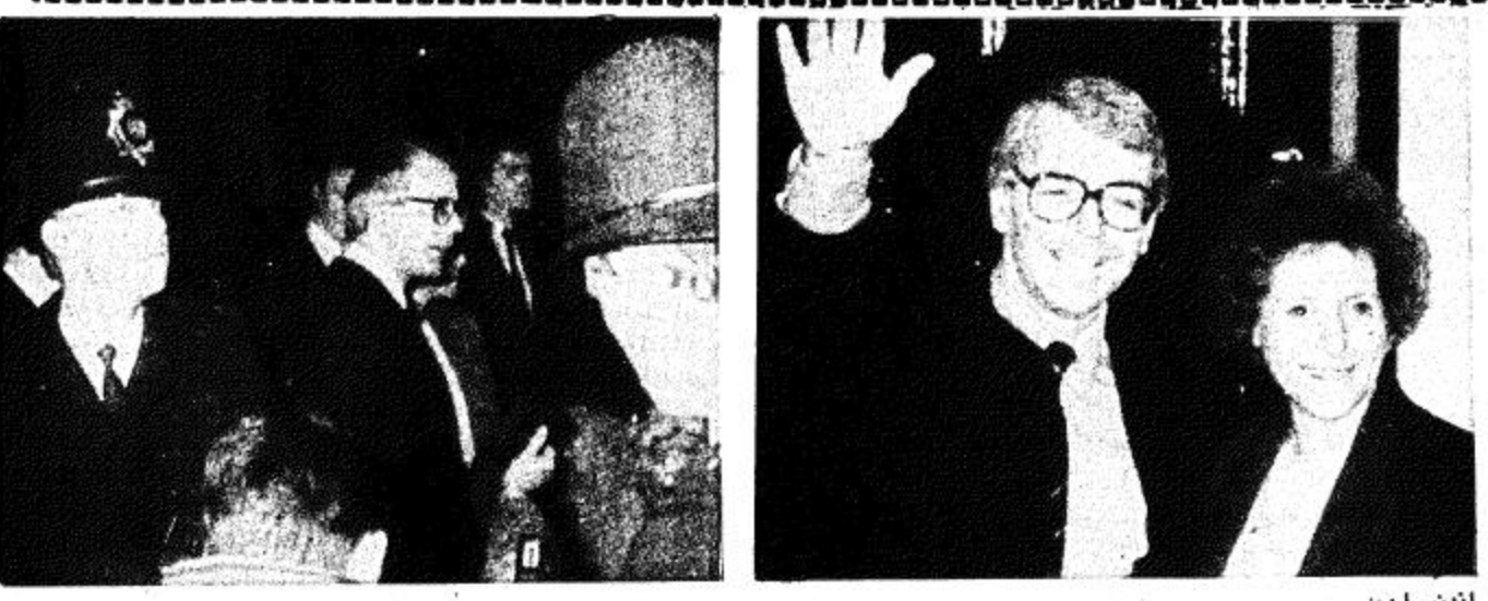
لندن جون ميغور رئيس وزراء بريطانيا الجديد مع قريبته نورما امام المقر الرسمي لرئيس الوزراء في ١٠ دوانتش استرليت مساء يوم الثلاثاء حيث ستولي المنصب عقب لفته مع الملكة اليزابيث الثانية ودعوته الى تشكيل الحكومة الجديدة.