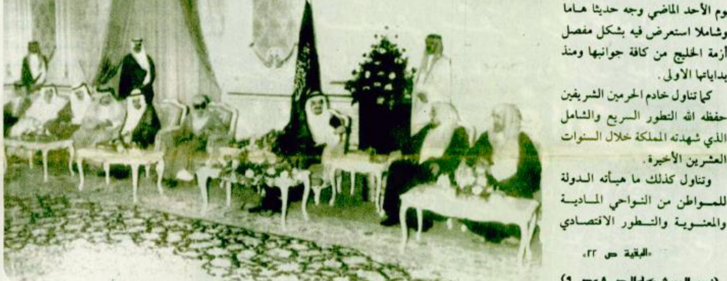
وجه خادم الحرمين الشريفين الملك فهد بن عبدالعزيز آل سعود في لقائه بأخوانه المواطنين يوم الأحد الماضي وجه حديثاً هاماً وشاملاً استعرض فيه بشكل مفصل أزمة الخليج من كافة جوانبها ومنذ بداياتها الأولى. كما تناول خادم الحرمين الشريفين حفظه الله التطور السريع والشامل الذي شهدته المملكة خلال السنوات العشرين الأخيرة. وتناول كذلك ما هيأته الدولة للمواطن من التواحي السديدة والمنسوبة والتطور الاقتصادي «البيعة ص ٢٢» (نص الحديث كاملاً ص ٨ و ص ٩)

سأثرون فيما يحقق رضا الله ومصالحة المواطن الكويت بلد مستقل من قديم الزمان والحديث يطول اذا رجعنا للتاريخ