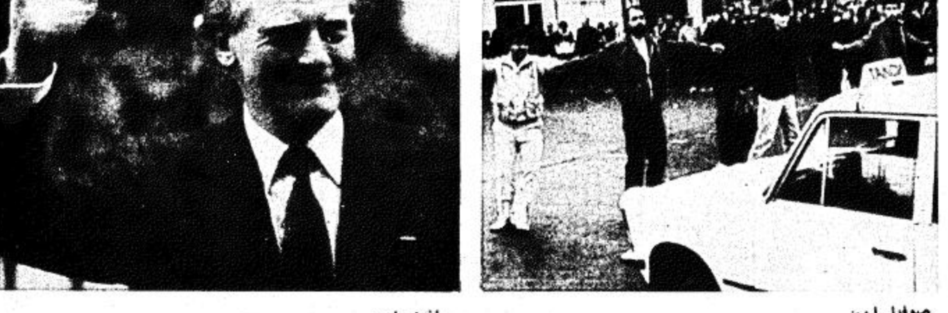
صوفيا - ا.ب. دخل الاشراب العام الذي عم جميع البلاد من اجل اسقاط الحكومة الاشتراكية في بلغاريا يومه الثاني.