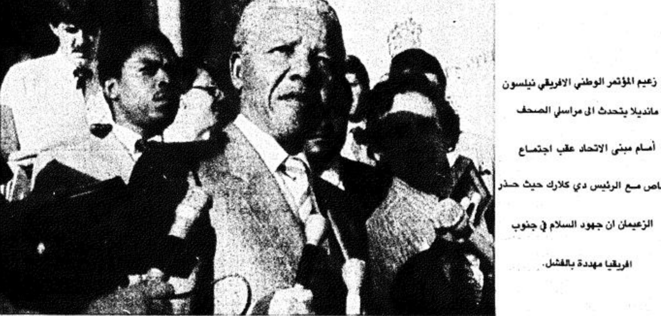
لندن زعيم المؤتمر الوطني الافريقي نيلسون مانديلا يتحدث الى مراسلي الصحف.