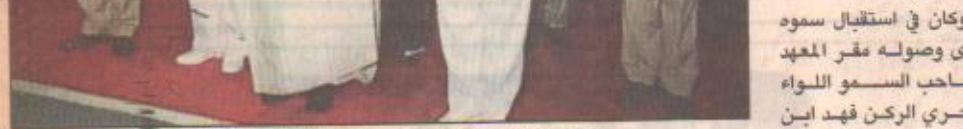
الأمير عبدالرحمن في حفل معهد الدراسات الفنية البحرية

الظهران - وادي السواسر - عبدالله الغضري - واس رعى صاحب السمو الملكي الأمير عبدالرحمن بن عبدالعزيز نائب وزير الدفاع والطيران والمفتش العام مساء أمس حفل تخريج طلبة معهد الدراسات الفنية للقوات البحرية بالدمام لعام ١٤٢٠هـ. وكان في استقبال سموه لدى وصوله مقر المعهد صاحب السمو اللواء البحري الركن فهد ابن عبدالله بن فهد قائد القوات البحرية وقائد معهد الدراسات الفنية للقوات البحرية اللواء البحري الركن محمد العتيبي.