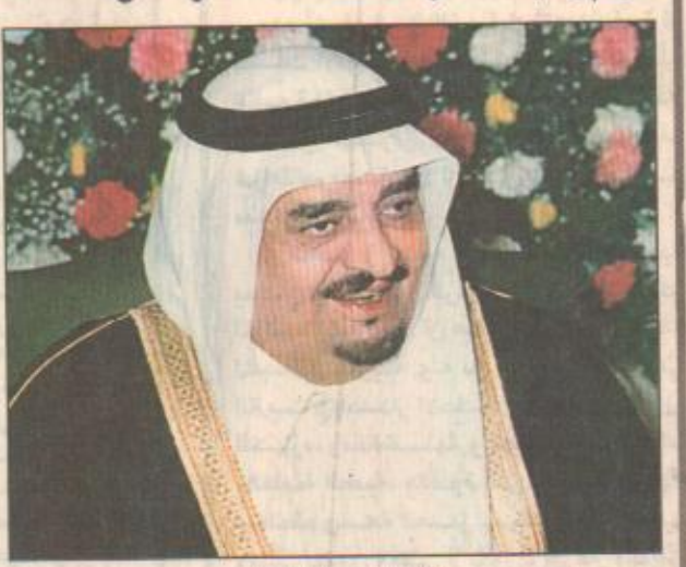
خادم الحرمين الشريفين الرياض - واس تلقى خادم الحرمين الشريفين الملك فهد بن عبدالعزيز - حفظه الله - مزيداً من البرقيات من عدد من إخوانه الزعماء العرب وكبار المسؤولين تتضمن الاطمئنان على صحته اثر العملية الجراحية التي اجريت في عينه اليسرى وتكثرت بفضل الله بالتخارج. وقد اجابهم - حفظه الله - بالشكر على معانيرها عنه من مشاعر طيبة وبعوات صادقة متمنياً للجميع موفور الصحة والسعادة.