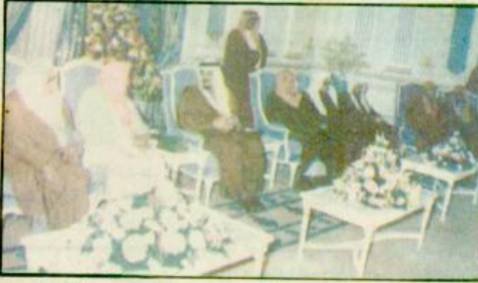
تلقى خادم الحرمين الشريفين الملك فهد بن عبدالعزيز آل سعود حثلة الله فخامة الرئيس زين العابدين بن علي مرزوقة من سرقيا التهانني بمناسبة