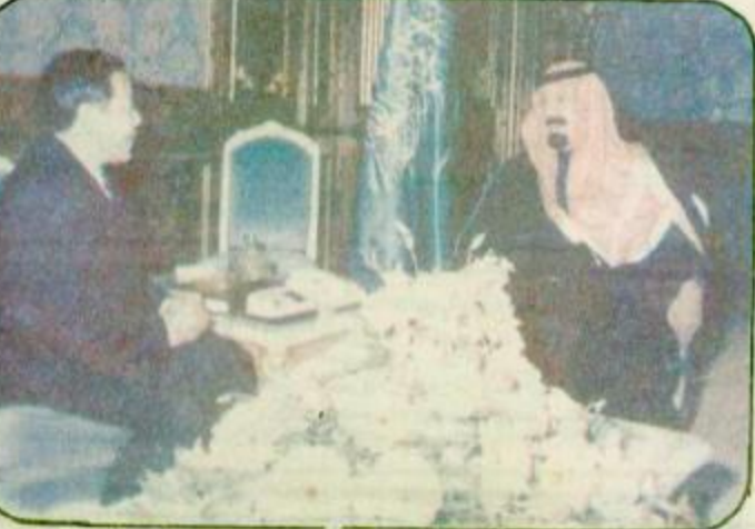
استقبل صاحب السمو الملكي الأمير عبدالله بن عبدالعزيز ولي العهد نائب رئيس مجلس الوزراء ورئيس الحرس الوطني في مكتب سموه في الديوان الملكي بقصر الصيادة بعد ظهر أمس بقصر جمهورية الصين الشعبية لدى الملكة العليمة سوزي في شأن الذي دوع سموه بمناسبة انتهاء فترة عمله سفيراً لبلاده لدى الملكة وحضر المصابلة معالي المستشار في ديوان سموه في العهدة الاستشارة عبدالصحن بن عبدالعزيز التوجيهي واسم «البقية ص ٣٠»