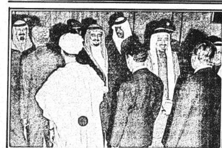
جلالة الملك يكرم السفراء

الرياض - وس - أقام جلالة الملك خالد بن عبد العزيز الفدي بعد مغرب اليوم بصر جلالة الملك حفل عشاء تكريماً لأصحاب السعادة السفراء ورجال السلك الدبلوماسي المعتمدين لدى المملكة الذين وصلوا عصر أمس إلى الرياض قادمين من جدة للتشرف بالسلام على جلالتهم. وقد حضر الحفل عدد من أصحاب السمو الملكي الأمراء يتقدمهم صاحب السمو الملكي الأمير فهد بن عبد العزيز ولي العهد ونائب رئيس مجلس الوزراء وصاحب السمو الملكي الأمير عبد الله الثالث نائب رئيس مجلس الوزراء ورئيس الحرس الوطني. كما حضره أصحاب المعالي الوزراء ورجال الديوان الملكي وكبار المسؤولين من مدنيين وعسكريين.