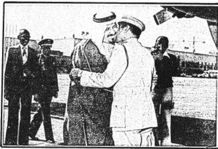
الدكتور شيخ عبدالله محمود

سمو وزير الدفاع يقيم ظهر اليوم حفل عشاء تكريماً للنائب الرئيس الصومالي ووزير الدفاع