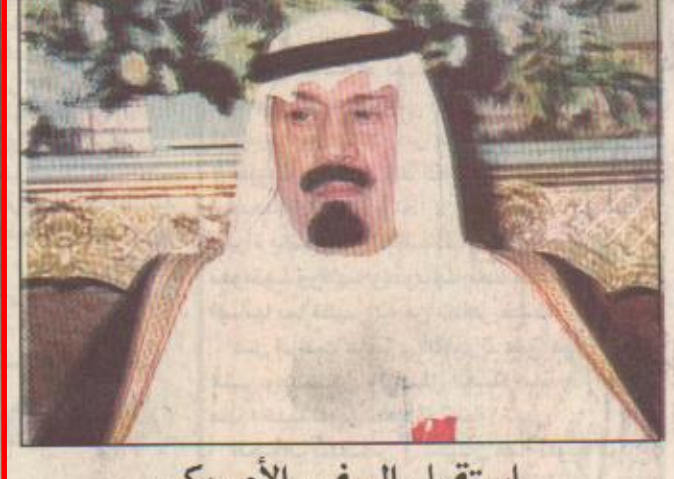
الملك عبدالله الثاني بن الحسين

العاقل الأردني ينوه بدعم خادم الحرمين الشريفين لبلاده خادم الحرمين الشريفين يعث برقية جوابية للملك عبدالله بن الحسين جدة / واس بعث خادم الحرمين الشريفين الملك فهد ابن عبدالعزيز آل سعود برفيقة جوابية لجلالة الملك عبدالله بن الحسين ملك المملكة الأردنية الهاشمية عبر فيها - حفلة الله - عن شكره الجزيل وتقديره الإخوي لشعبه الأيوبي ومشاعر الوفد المرافق والشعب الأردني الشقيق بمناسبة زيارته لبلده الثاني المملكة العربية السعودية تجسيدا وتأكيدا للتواصل الإخوي واتحافا من تعزيز الروابط والعلاقات الوثيقة بين البلدين الشقيقين. وقال حفلة الله، كان سرورا بالغا للحديث مع جلالكم وإن تطابق وجهات النظر بين بلدينا الشقيقين في مختلف القضايا يعكس حقيقة عمق العلاقات بينهما وحرصنا المشترك على تعزيزها في مختلف الظروف» (الفاصل ص ٣) وكان الملك عبدالله بن الحسين قد بعث برفيقة شكر وتقدير لخادم الحرمين الشريفين وسمو ولي عهده الأمين للخضوة التي فوبل بها والوفد المرافق الذي زيارته للملكة كما أدى بتصرفات صحفية عقب عودته إلى بلاده أسس اعرب فيها عن الشكر والتقدير على الدعم والإسناد اللذين لقيهما الزين من حكومة خادم الحرمين الشريفين ملكا وحكومة وشعبا عقب رحيل الملك حسين رحمه الله.