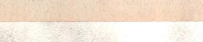
الأمير محمد بن فهد